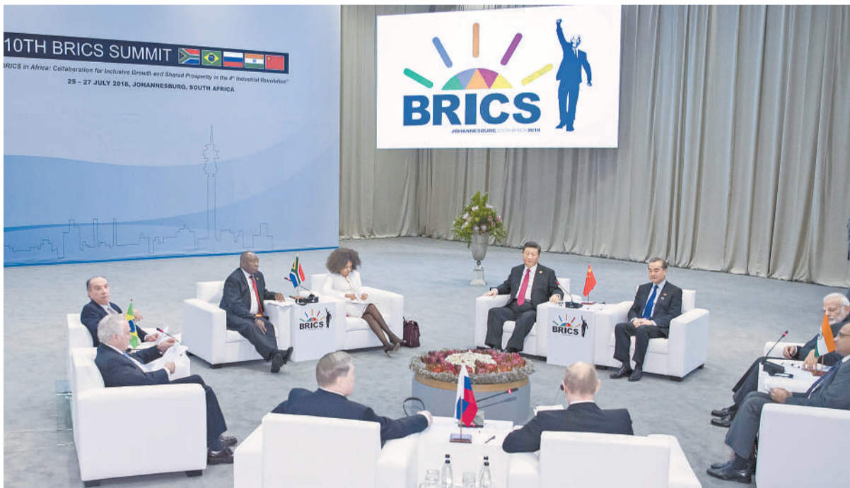
7月27日,纪念金砖国家领导人会晤10周年非正式会议在南非约翰内斯堡举行。中国国家主席习近平、南非总统拉马福萨、巴西总统特梅尔、俄罗斯总统普京、印度总理莫迪出席。

本报约翰内斯堡7月27日电 记者黎越 蔡淳报道:纪念金砖国家领导人会晤10周年非正式会议27日在南非约翰内斯堡举行。中国国家主席习近平、南非总统拉马福萨、巴西总统特梅尔、俄罗斯总统普京、印度总理莫迪出席。