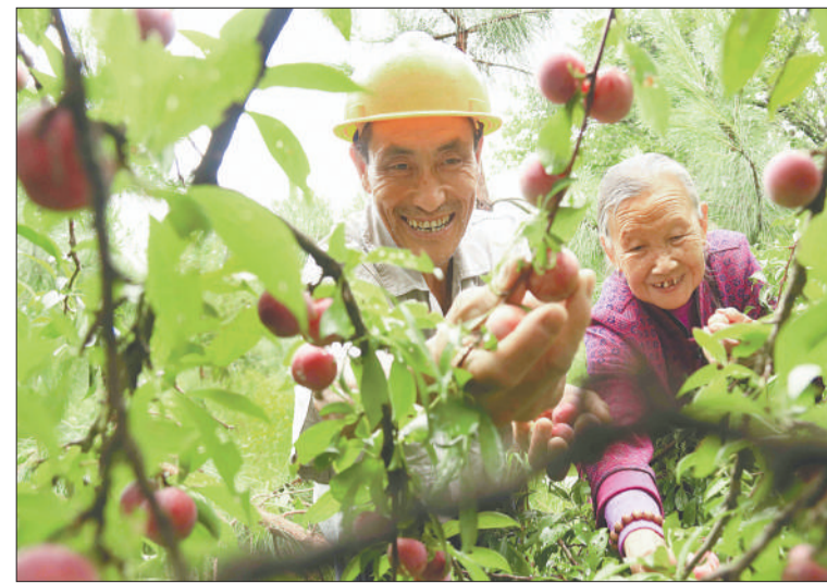
▲江西省乐安县万崇镇熟元村农民为游客采摘成熟的鲜红李。近年来,该县大力发展旅游产业,鼓起农民的钱袋子。