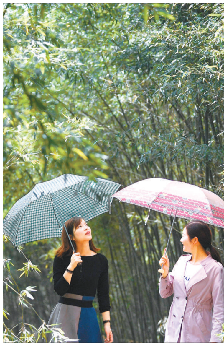
▼河南省驻马店市驿城区老河乡,游客在竹林赏景。近年来,当地大力发展生态游、乡村旅游等,为农民增收创造条件。