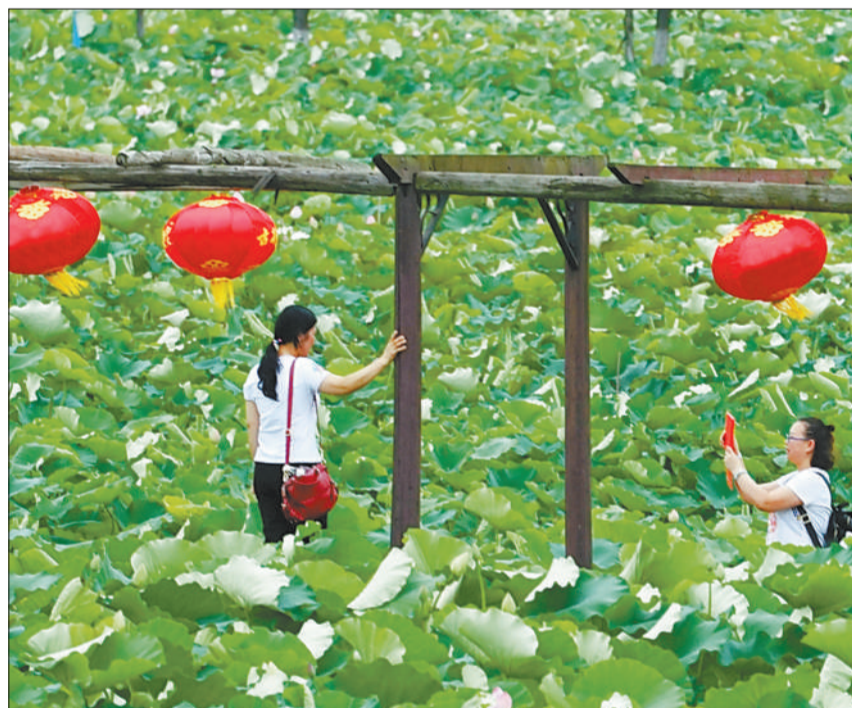
►安徽省肥东县建华社区荷塘里,千亩荷花清香扑鼻,吸引游客前来赏荷。