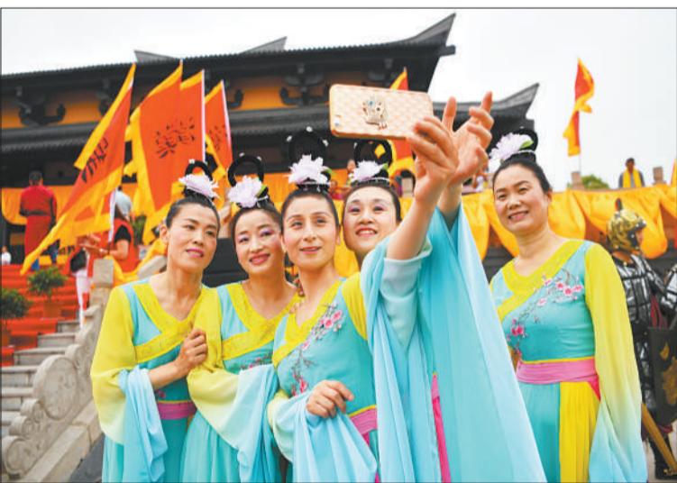
▲江苏省徐州市沛县游客在景区内合影。当地深挖文化内涵,突出自然禀赋,满足人民美好生活需求。