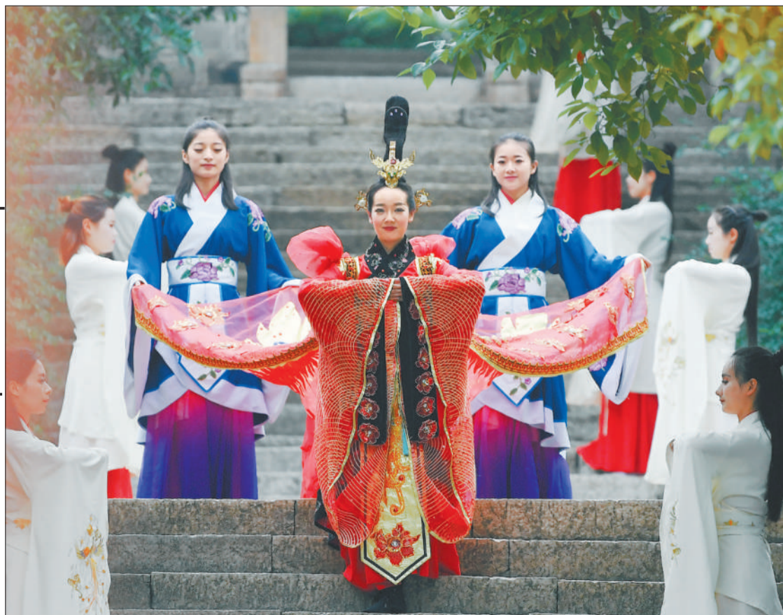
►湖北省宜昌市兴山县昭君村景区,《昭君别乡》正在上演。昭君村景区是全国民族团结进步教育基地和爱国主义教育基地,吸引了大批游客前来了解昭君文化。