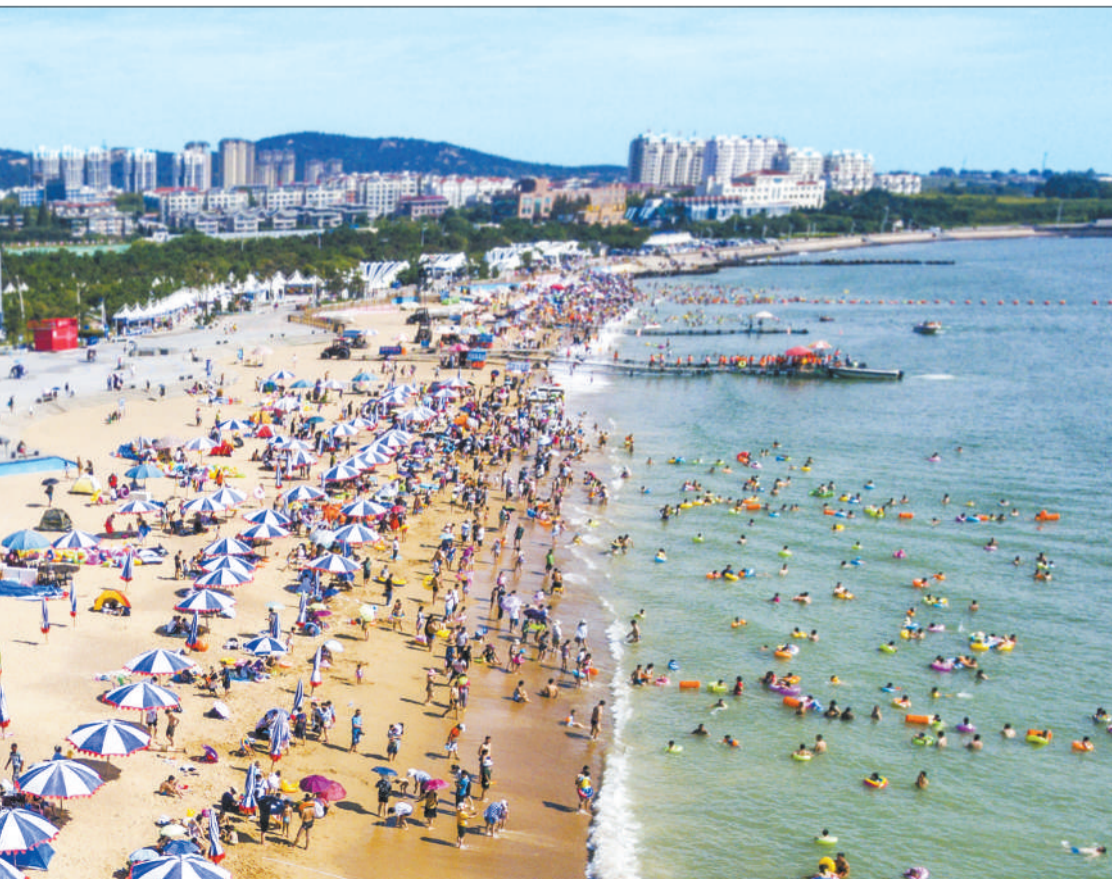
►山东省日照市山海天旅游度假区阳光海岸,游客尽情享受蓝天、碧海和金色沙滩。暑期到来,前来日照旅游的游客数量猛增。

本版主编 李景录 编辑 高兴贵 邮 箱 jjrbsyb58392306@163.com