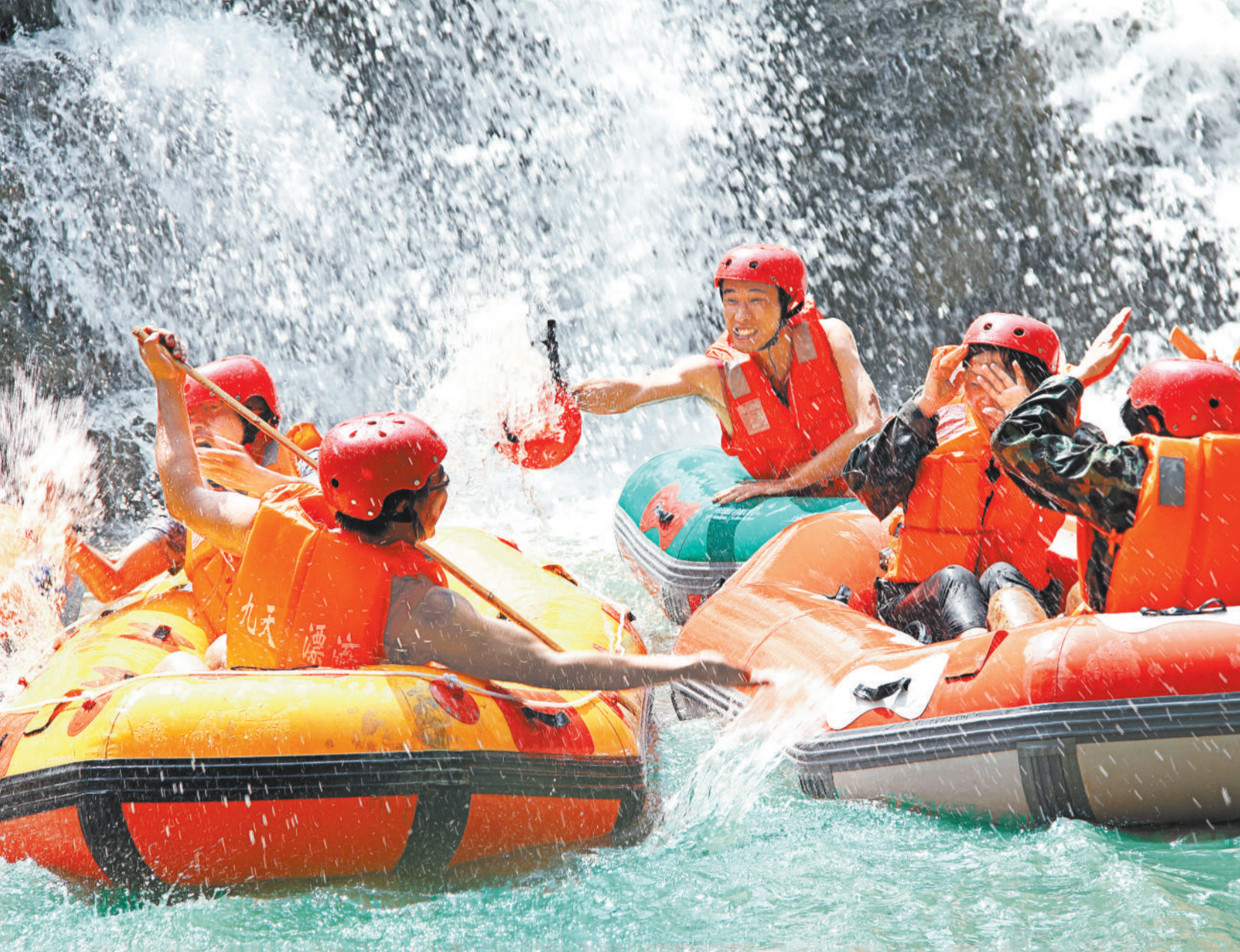
▲暑期高温,游客纷纷来到江西省宜春市黄岗山垦殖场九天高落差峡谷漂流区,与“浪”共舞,消暑纳凉。