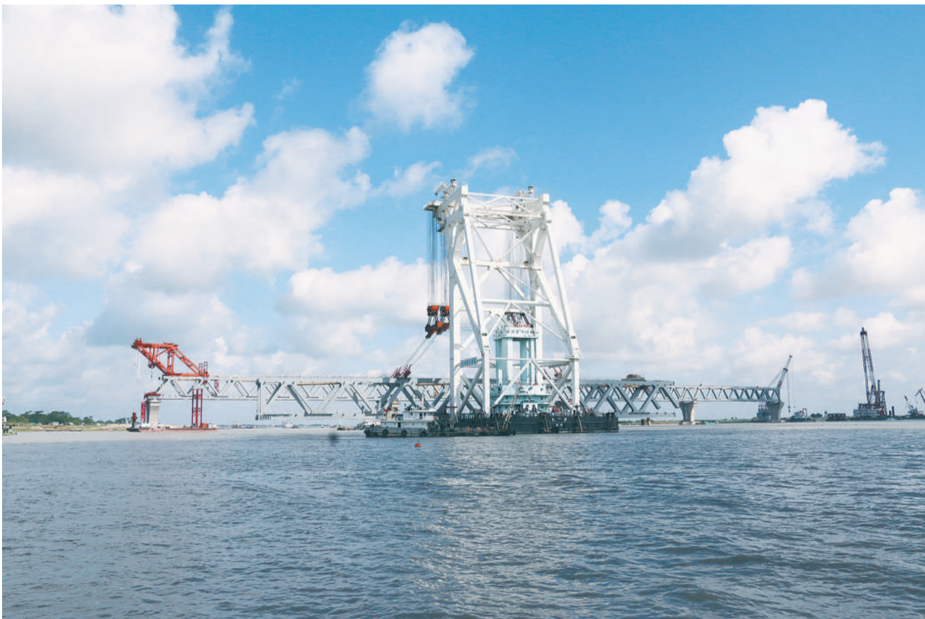
6月29日,中国建造的万吨级中心架梁起重船“天一号”在孟加拉国的帕德玛大桥施工现场作业。

在这样的背景下,中国在中多边贸易体制发展进程中的参与程度和推动力度被寄予更多期待,同时,中国也将不负期待。中国将在世贸组织的合作框架下,一如既往、旗帜鲜明地反对单边主义和保护主义,积极利用世贸组织这一多边合作平台,倡导和推动自由贸易,与多数成员发出反对单边主义和保护主义的共同声音,维护多边贸易体制的“清流”;中国将在平等参与、透明开放的原则下,与世贸组织所有成员一起,与时俱进地探讨完善现有规则,加强世贸组织的权威性,推动经济全球化朝着开放、包容、普惠、平衡、共赢的方向发展。