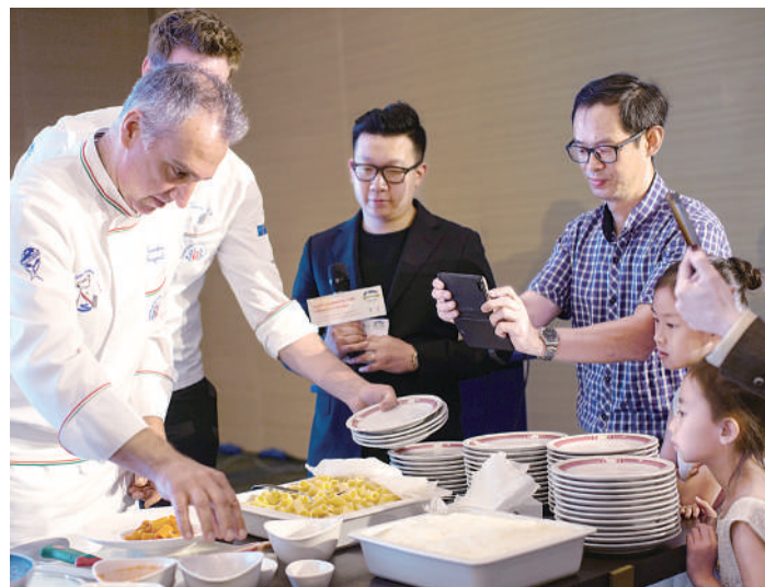
“兰州牛肉拉面牵手意大利面”暨兰州市文化旅游推介活动日前在意大利罗马拉开帷幕,来自中意两国的厨师在活动现场“同台竞技”。此外,兰州市还带来了特色演出和民间手工技艺展示。图为意大利厨师在制作意大利面。