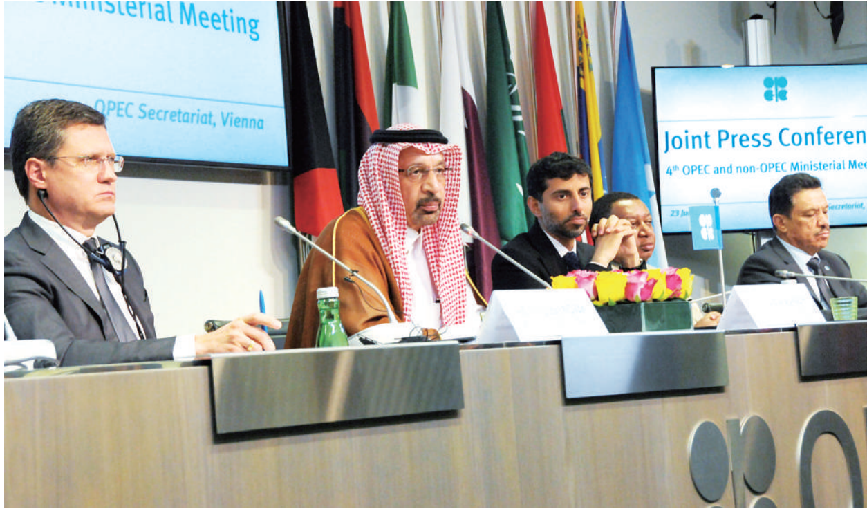
6月23日,在奥地利维也纳,俄罗斯能源部长诺瓦克、沙特阿拉伯石油大臣法利赫、阿联酋能源部长马兹鲁伊和欧佩克秘书长巴尔金多(从左至右)出席新闻发布会。

沙特能源部长法利赫表示,今年下半年全球将面临160万桶/日至180万桶/日的石油供给短缺,欧佩克不能容许这样的短缺发生,需要考虑释放石油产量。在以沙特为代表的欧佩克国家和以俄罗斯为代表的非欧佩克产油国推动下,“欧佩克+”决定增加原油