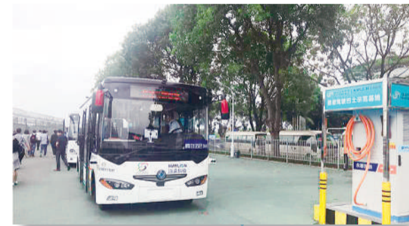
在深圳福田保税区，智能驾驶公交车阿尔法巴在预设路线上试运行。

在试运行的基础上，智能公交将扩大试运行范围及示范内容，将5G、车联网、车路协同、高精度地图、智慧调度等技术融合应用。福田保税区也将被打造成国家级智能网联汽车及未来智慧出行生态示范区。