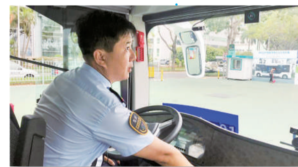
智能公交上仍配有司机，驾驶过程中司机无须双手随时紧握方向盘。