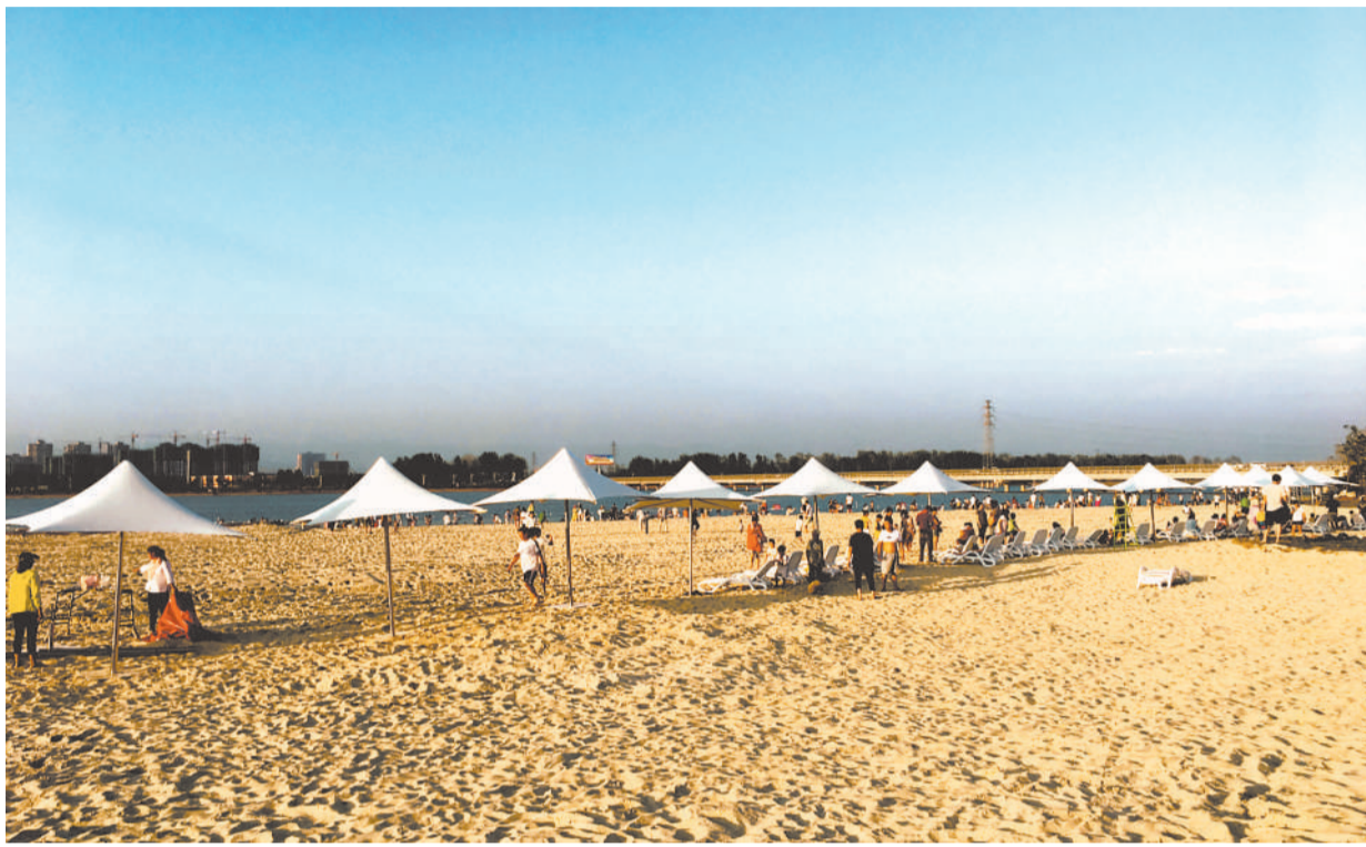
游客在汝河沙滩公园游玩。从“半城煤灰半城土”到“一城青山半城湖”，昔日“煤城”河南汝州华丽转身，走出一条新型城镇化道路。

战。在当前与未来，中国城市伴随繁荣而来的是诸多风险和问题，城市在过快增长的同时导致城市化泡沫的情况放大，城市发展结构失衡加剧，城乡之间、城市之间、城市内部分化严重。”王伟光表示，这不仅导致城市发展的不可持续，而且导致泡沫破灭和风险变现，城市化和工业化初期所拥有的关键优势在削弱，包括人口红利消失、生产成本上升、生态环境恶化、收入差距拉大等。此外，随着中国城市的进一步发展，中国城市越来越面临发达国家城市和发展中国家城市的竞争性冲击。