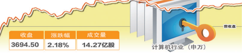
6月22日波动最大行业走势图