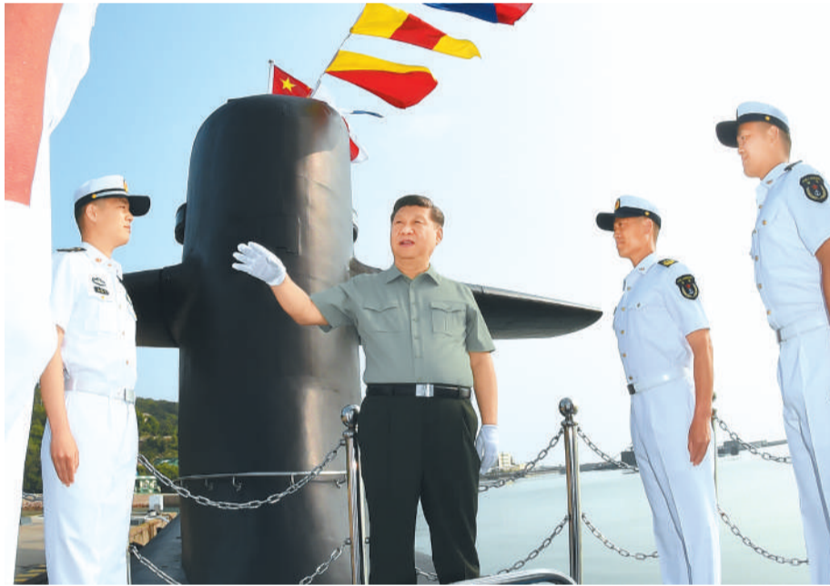
6月11日下午,中共中央总书记、国家主席、中央军委主席习近平视察北部战区海军。这是习近平来到某潜艇部队,登上潜艇,同艇员亲切交谈。