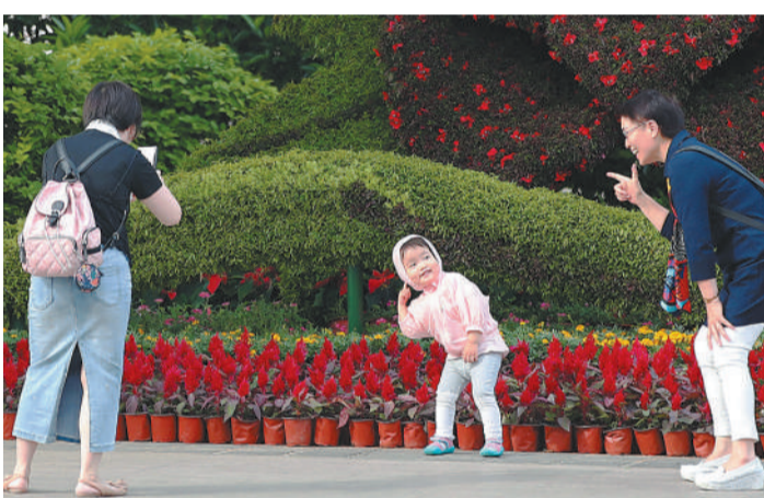
▶游客在青岛市内的花坛前拍照留念。