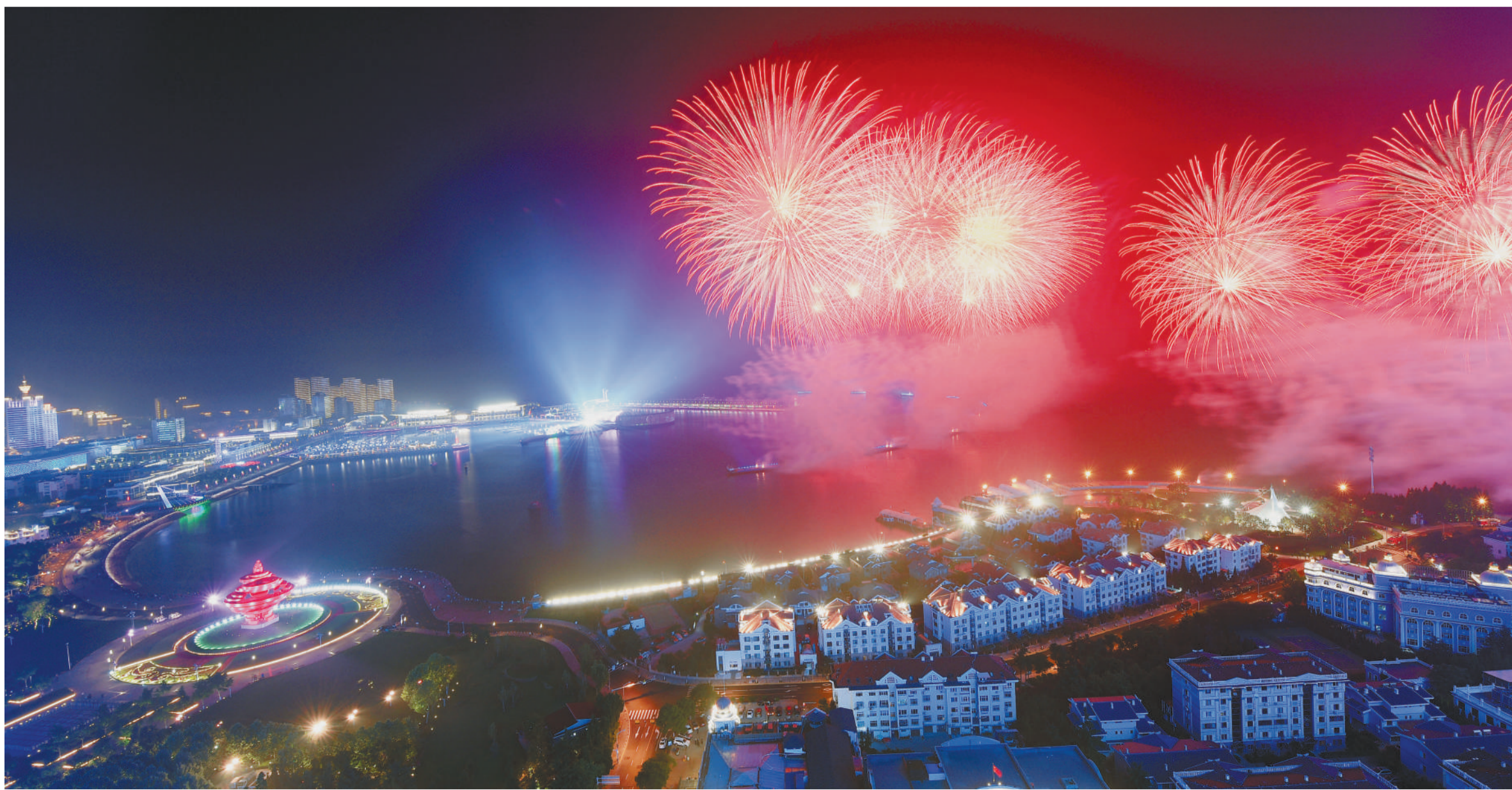
▶六月九日晚，《有朋自远方来》灯光焰火艺术表演在青岛市浮山湾海面精彩上演。

本版主编 李景录 编辑 管培利 邮箱 jirsyb58392306@163.com