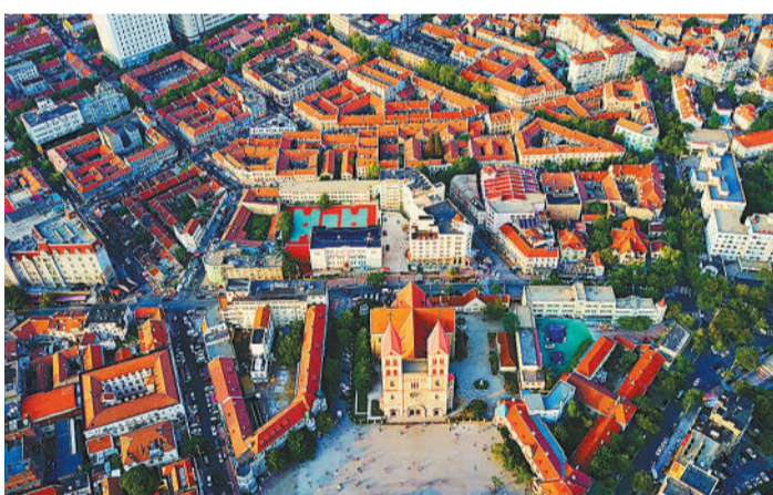
▶青岛市城市建筑别具一格，红瓦绿树，美不胜收。