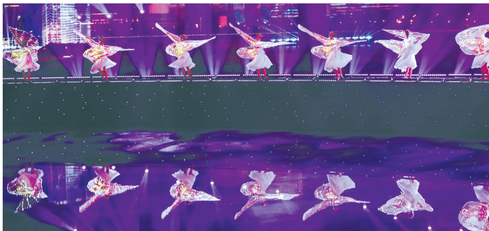
◀6月9日晚在青岛举行的《有朋自远方来》灯光焰火艺术表演。