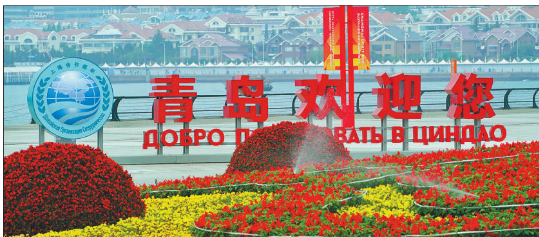
▶青岛市大街小巷鲜花绽放迎宾朋。