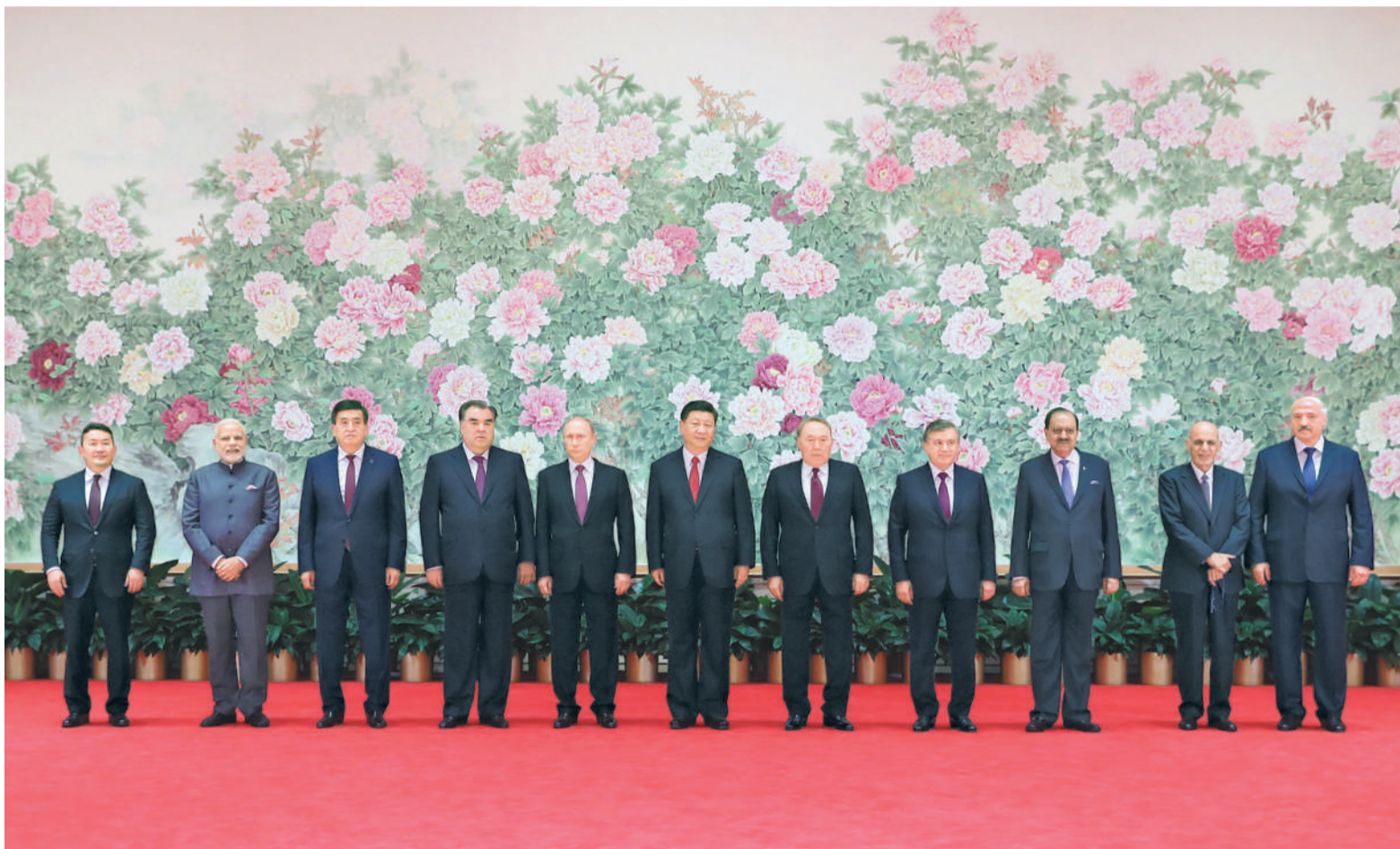
6月9日,国家主席习近平在青岛国际会议中心举行宴会,欢迎出席上海合作组织青岛峰会的外方领导人。这是习近平同外方领导人在巨幅工笔画《花开盛世》前合影留念。

新华社青岛6月9日电 (记者赵新兵 孙奕) 国家主席习近平9日在青岛国际会议中心举行宴会,欢迎出席上海合作组织青岛峰会的外方领导人。