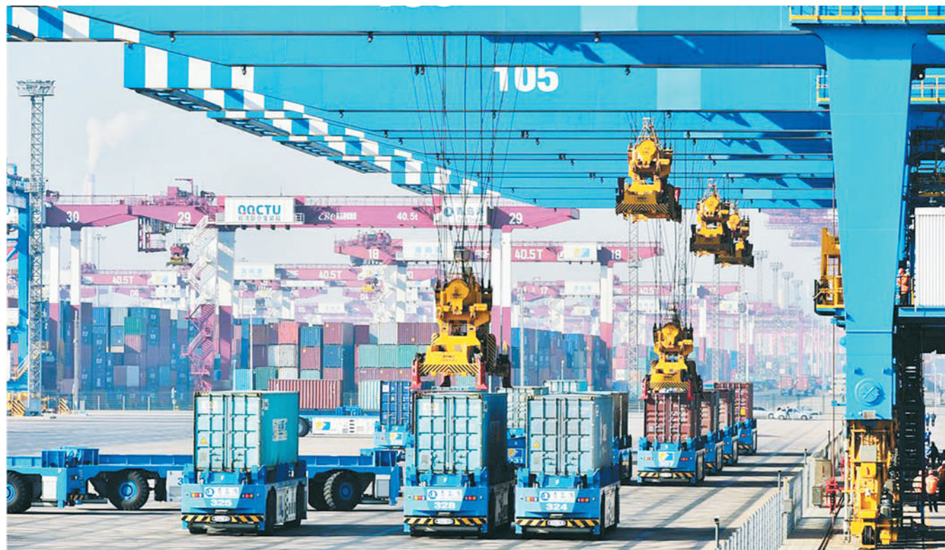
青岛港与上合组织其他成员国贸易频繁

与此同时，山东企业对外投资合作十分活跃，2017年全省实际对外投资、对外承包工程营业额、派出劳务人员3项指标分别居全国第五位、第二位、第一位。近年来，山东积极融入“一带一路”建设，2017年全省对“一带一路”沿线国家实际投资100.6亿元，增长81.7%；有9个市开