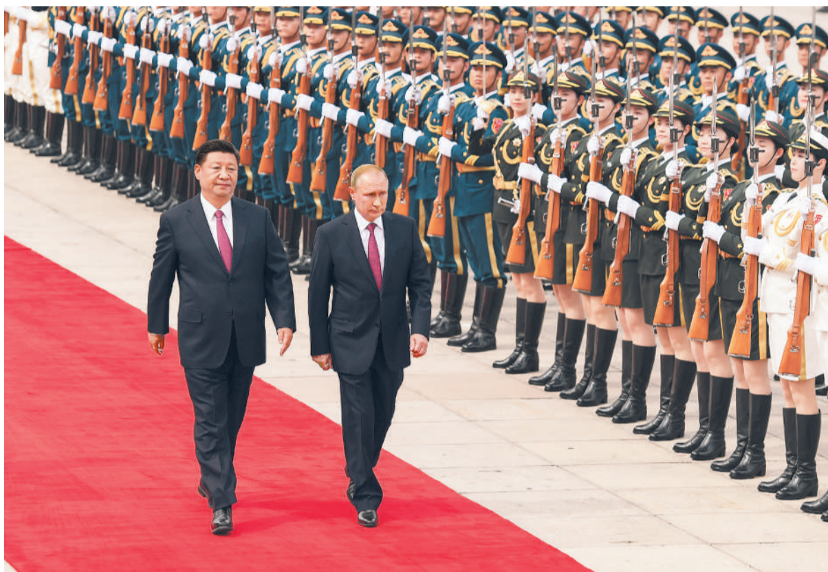
6月8日,国家主席习近平在北京人民大会堂同俄罗斯总统普京举行会谈。这是会谈前,习近平在人民大会堂东门外广场为普京举行欢迎仪式。

新华社北京6月8日电 (记者白洁 吴嘉林) 8日,国家主席习近平在人民大会堂同俄罗斯总统普京举行会谈。两国元首一致同意,秉持世代友好理念和战略协作精神,拓展和深化各领域合作,推动新时代中俄关系在高水平上实现更大发展。中共中央政治局常委、国务院副总理韩正参加会谈。 习近平再次祝贺普京开始新一届总统任期,赞赏普京选择中国作为新任首个进行国事访问的国家。习近平指出,中俄全面战略协作伙伴关系成熟、稳定、牢固。无论国际形势如何变幻,中俄始终坚定支持对方维护核心利益,深入开展各领域合作,共同积极参与全球治理,为推动建设新型国际关系、构建人类命运共同体发挥了中流砥柱作用。中方愿同俄方一道努力,久久为功,巩固高水平互信,拓展各领域合作,深化人文交流互鉴,密切国际协调配合,把中俄世代友好理念一代代传承下去,不断充实两国协作战略内涵,推动中俄关系与日俱进,与日俱新,造福两国人民。