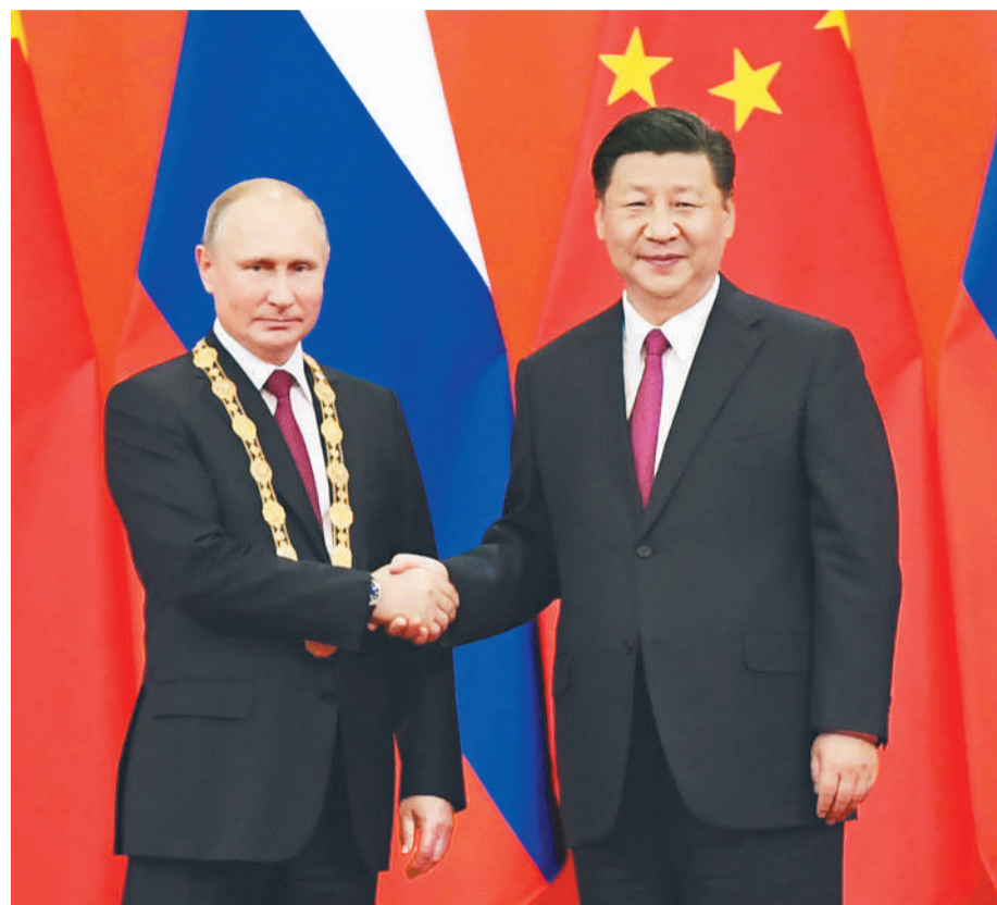
6月8日,中华人民共和国“友谊勋章”颁授仪式在北京人民大会堂金色大厅隆重举行。国家主席习近平向俄罗斯总统普京授予首枚“友谊勋章”。

习近平强调,在双方共同努力下,当前中俄各领域合作保持强劲势头,利益融合不断深化,“一带一路”建设同欧亚经济联盟对接取得重要早期收获。双方要认真研究各领域合作新思路新举措,将两国高水平政治关系优势转化为更多实际合作成果。要加强两国人文合作,增进人民友谊。 习近平指出,中俄同为联合国安理会常任理事国,坚定维护以联合国宪章宗旨和原则为核心的国际秩序和国际体系,倡导国际关系民主化,促进热点问题政治解决进程,继续为维护世界和平和国际战略稳定发挥积极作用。中方愿同包括俄方在内的上海合作组织各成员国一道,以青岛峰会为契机,进一步弘扬“上海精神”,确保上海合作组织继续健康稳定发展。 普京表示,深化俄中全面战略协作伙伴关系是俄罗斯外交的优先方向。俄中双方相互照顾彼此核心利益和重大关切,积极推进政治、经济、人文各领域对话合作,密切在国际事务中沟通协调。 (下转第二版)