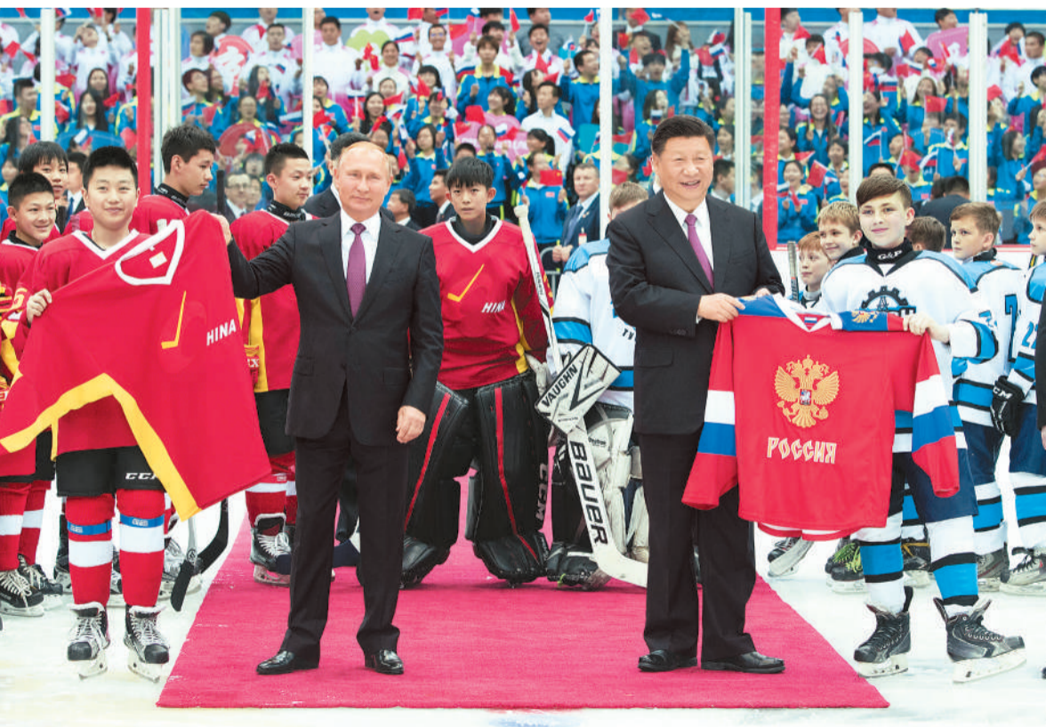
6月8日晚,国家主席习近平同俄罗斯总统普京在天津共同观看中俄青少年冰球友谊赛。这是小球员们分别向习近平和普京赠送俄、中两队球衣。

新华社天津6月8日电 (记者侯丽军) 国家主席习近平8日晚同俄罗斯总统普京在天津共同观看中俄青少年冰球友谊赛。 天津体育馆内座无虚席,气氛热烈。场馆上方悬挂红色欢迎条幅,两侧大屏幕滚动播放中俄青少年冰球队员训练和两国运动员参加冬奥会的比赛画面。 19时40分许,在欢快的乐曲声中,习近平同普京共同进入体育馆。全场7000余名观众起立欢呼,