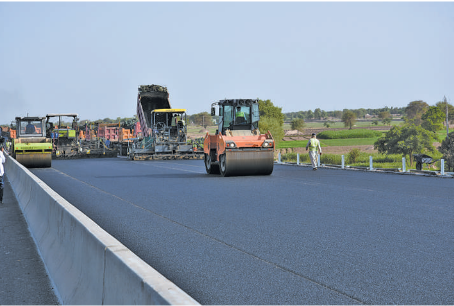
酷暑下紧张施工的苏木段高速公路项目工地。

按照合同规定的36个月工期计算,整个苏木段预计完工日期为2019年8月份,实际较合同规定期限提前了14个月。中建PKM项目部执行总经理李干椿