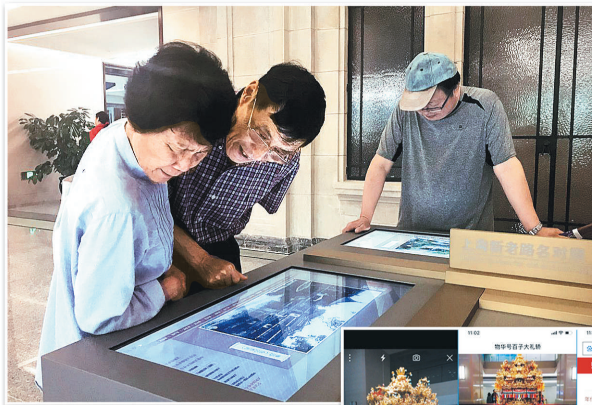
▲观众在上海历史博物馆内体验高科技。

在科技“加持”下，博物馆焕然一新。越来越多的市民开始走进博物馆，感受文化与科技带来的双重魅力