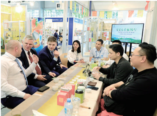
日前,在波兰比兹南举行的国际食品展上,来自浙江安吉县的8位茶农在参展现场与27个国家的茶商签订销售合同170吨,创造了安吉白茶批量出口最高纪录。安吉县为打造“白茶小镇”,组织茶农带着白茶来到波兰,利用国际市场平台,让世界爱上中国茶。