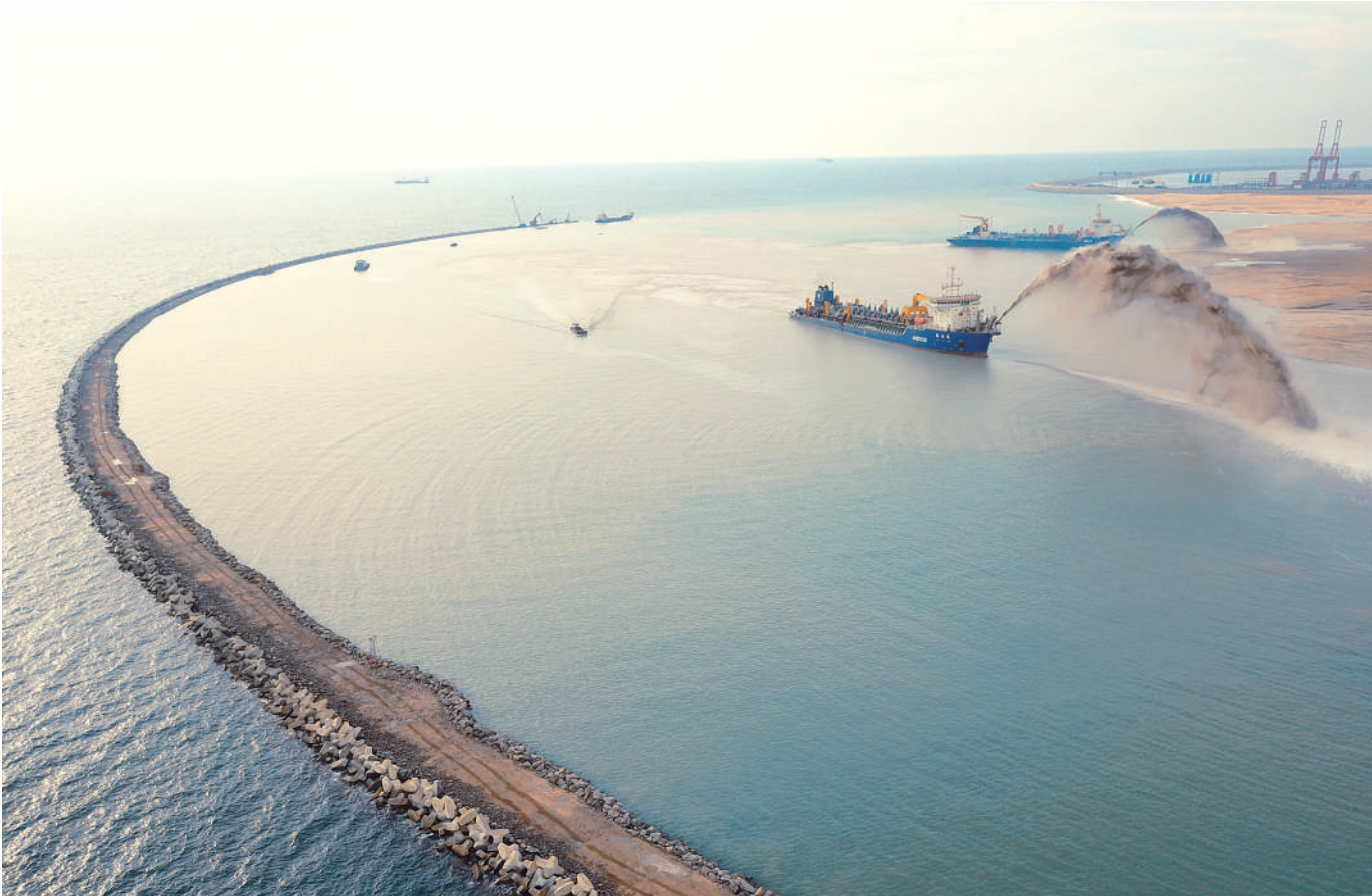
科伦坡港口城项目是中国与斯里兰卡在“一带一路”建设中的重点合作项目,由斯里兰卡政府和中国港湾科伦坡港口城有限责任公司联合开发,于2014年9月动工,整体开发时间约25年。图为吹沙船在科伦坡港口城项目上进行疏浚吹填作业。

不积跬步，无以至千里。“一带一路”倡议提出以来，已从理念转化为行动、从愿景转变为现实——政策沟