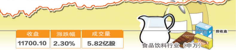
5月14日波动最大行业走势图