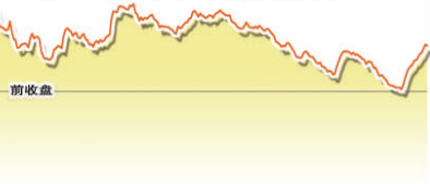
5月14日上证综指走势图