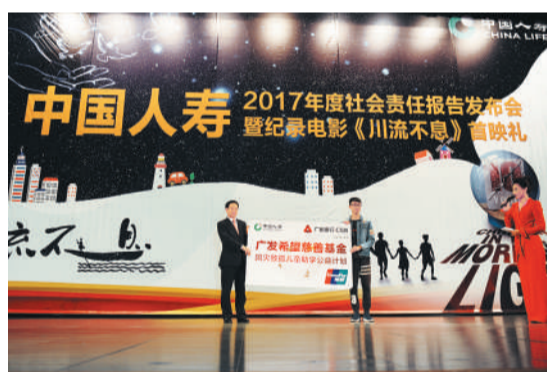
广发银行行长刘家德在现场发布了助学公益计划。