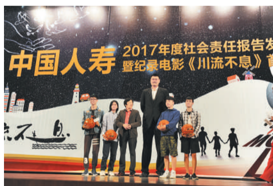
中国人寿全球形象代言人姚明和影片导演焦波、汶川地震灾区的四个孩子合影留念。