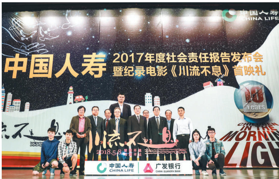
5月8日,中国人寿2017年度社会责任报告发布会暨纪录电影《川流不息》首映礼在京举行。中国人寿领导与到场嘉宾在发布会现场合影留念。

2018年,是改革开放40周年,决胜全面建成小康社会、实施“十三五”规划承上启下的关键一年。2018年,对于中国人寿而言更是实干之年。作为负责任金融央企,中国人寿始终秉承“成己为人、成人达己”企业文化核心理念,以不断满足客户和社会期待作为公司发展的立足点,积极服务大局、助力国家建设,让全社会共享企业快速发展的成果。