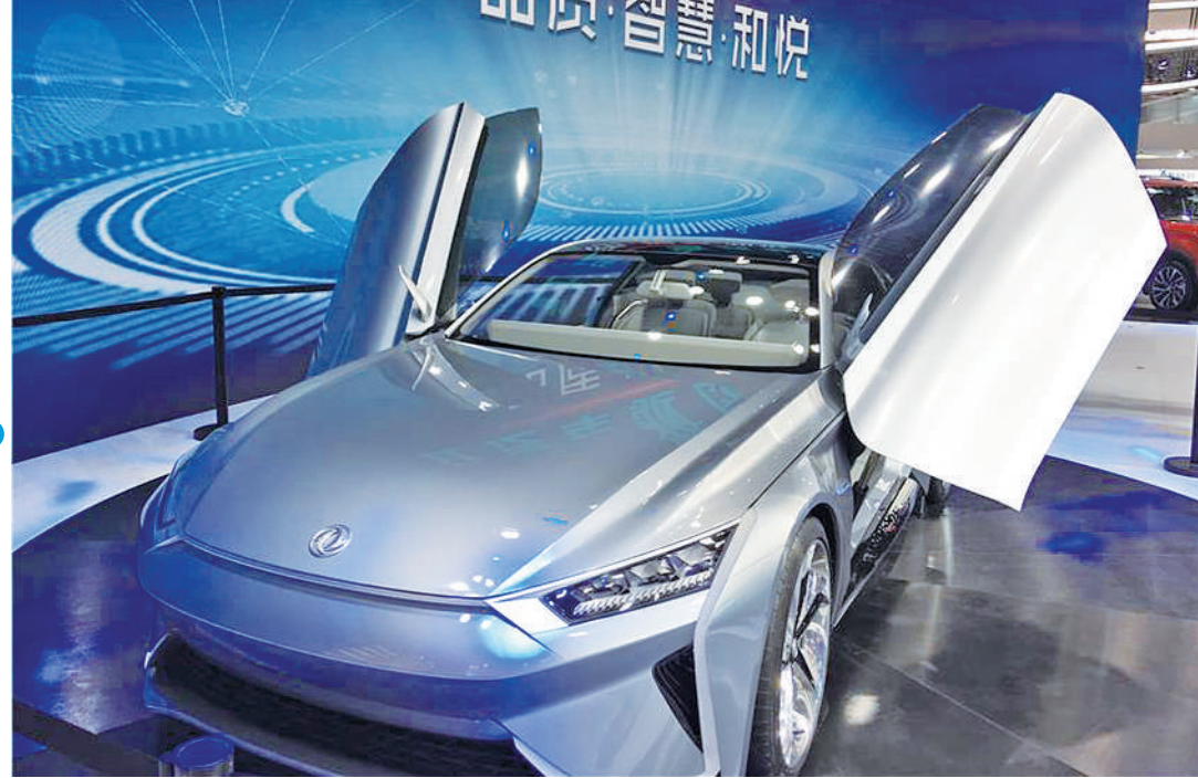
东风汽车集团发布首款新能源高性能轿跑概念车eπ。该车立足于搭载先进的智能系统,具备500公里(纯电动)续航及1000公里(插电)续航能力,低于4s的百公里加速性能。

“面对合资股比即将放开,外资投资不再受限,汽车进口关税进一步下调,自主品牌车企不断推出新产品和新技术。与此同时,自主品牌传统车企转型压力倍增,只有更注重自主创新和研发,才能找到出路——