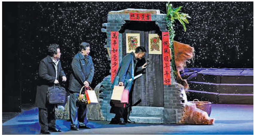
图为话剧《县委书记廖俊波》剧照。

舞台上的“共产党员廖俊波”不是一个人，他是我们国家当代所需要的千千万万个像廖俊波一样的共产党员