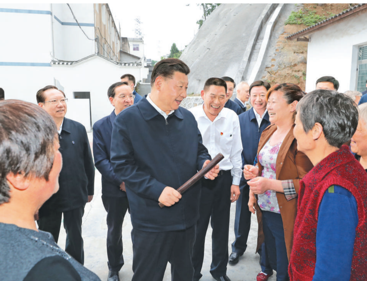
4月24日至28日,中共中央总书记、国家主席、中央军委主席习近平在湖北考察。这是24日下午,习近平在宜昌市许家冲村考察时,在便民洗衣池边同村民亲切交谈。

新华社武汉4月28日电 中共中央总书记、国家主席、中央军委主席习近平近日在湖北考察时强调,全面贯彻党的十九大精神,以新时代中国特色社会主义思想为指导,坚持新发展理念,坚持稳中求进工作总基调,着力打好“三大攻坚战”,扎实解决发展不平衡不充分问题,奋力谱写新时代湖北发展新篇章。