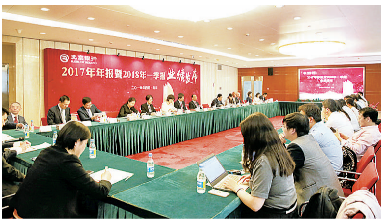
2018年4月26日，北京银行召开2017年年报暨2018年一季度业绩发布会

广覆盖的渠道服务体系，推进线上、线下渠道智能融合，持续提升金融服务质效。截至2018年一季度末，已在全国12个主要省市设立24家一级和二级分行，全行分支机构总数达到607家，并在重庆、云南设立多家村镇银行。成功搭建网上银行、手机银行、微信银行等十大线上渠道体系。