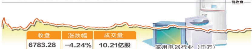
4月26日波动最大行业走势图