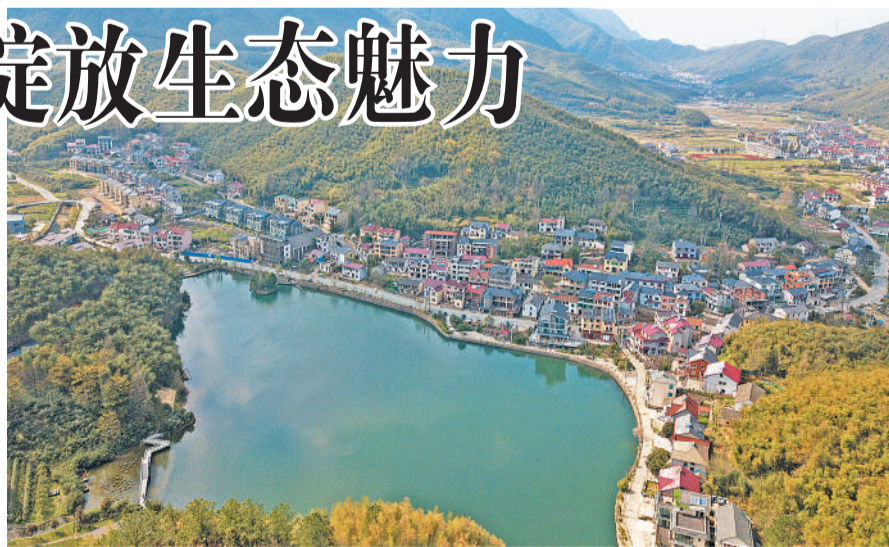
俯瞰浙江省安吉县山川乡高家堂村(3月23日无人机拍摄)。

埃尔多安表示,土方高度重视中方在政治解决叙利亚问题上的重要影响,愿同中方就相关问题加强沟通协调。