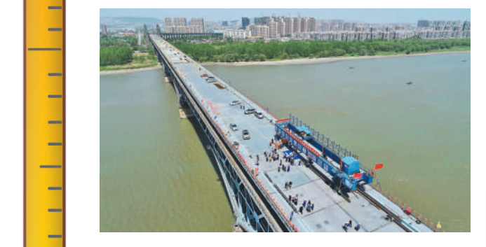
△4月10日，南京长江大桥维修改造工程桥面板安装任务完成，公路钢桥面板实现合龙。