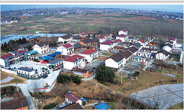
陕西汉中市汉台区汉王镇红星村651名村民100%入股土地合作社。

主理财小组成员组成工作组,对各类资产进行清查核实;对于集体资产较多或资产虽少但争议较大的村,则根据群众意愿聘请第三方进行清产核资。清产核资后,各村大多建立了成员名册,详细记载成员信息,并在县乡主管部门备案,有些还纳入农村集体资产监管平台。通过确认成员身份,厘清了集体成员边界,集体成员代表大会确认。业内专家认为,改革中,要充分发挥农民的主体作用,确保他们的知情权、参与权。