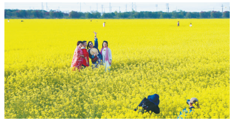
油菜花海吸引游客前来。浙江慈溪市通过围垦和改良,将昔日盐碱荒滩改造为现代化农业园区和生态农业观光基地。