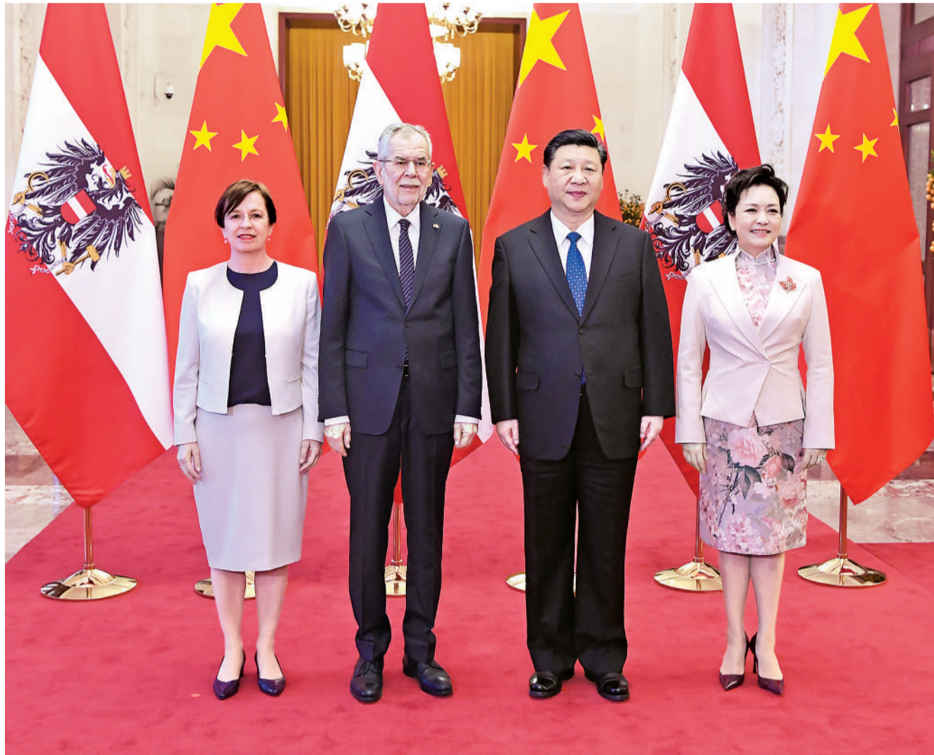
4月8日,国家主席习近平在北京人民大会堂同奥地利总统范德贝伦举行会谈。这是会谈前,习近平在人民大会堂北大厅为范德贝伦举行欢迎仪式。

习近平指出,今年是中欧建立全面战略伙伴关系15周年,中欧关系发展势头总体良好。欧盟保持团结、稳定、开放、繁荣符合中方利益,中方支持欧洲一体化的一贯立场不会改变,希望奥方为增进中欧战略互信、促进中欧全方位合