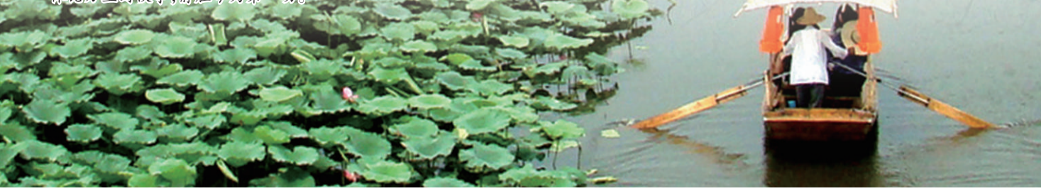
荷红苇绿的季节,华北明珠白洋淀以独特的魅力吸引着四方宾朋。至以工摄

(登雄州视远亭) 北压三关气象雄,主人仍是紫髯翁。樽前乐按摩诃曲,塞外威生广漠风。龙向城头吟画角,雁从天末避雕弓。侏侻万里封侯事,静胜吟为第一功。