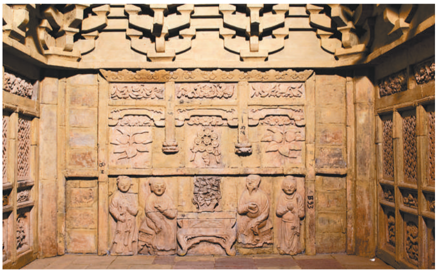
图为山西博物院收藏的金墓砖雕。