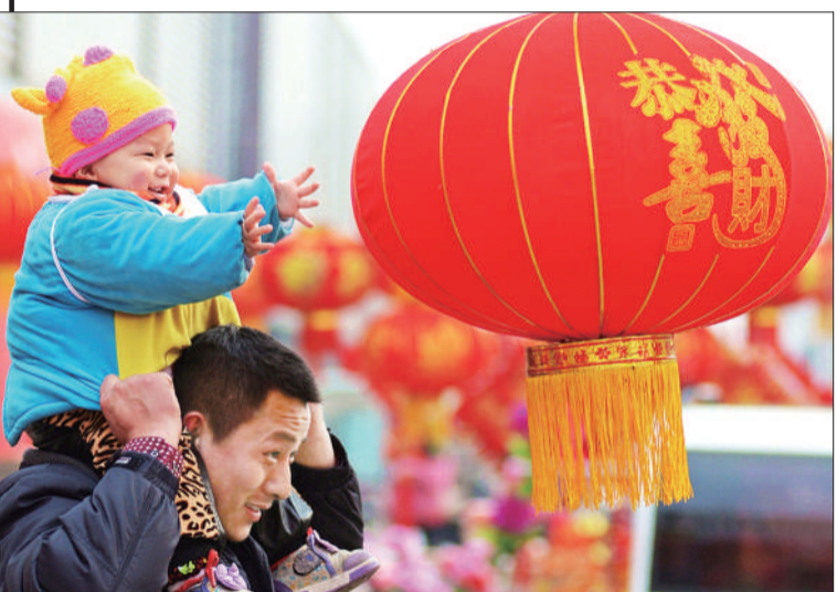
《喜在眉梢》 摄于山东能源枣庄矿集团柴里煤矿年货市场。 ▲点评：占据画面一半的大红灯笼，衬托出节日氛围，儿童双手张开拥抱灯笼，与之呼应成为作品的点睛之笔。