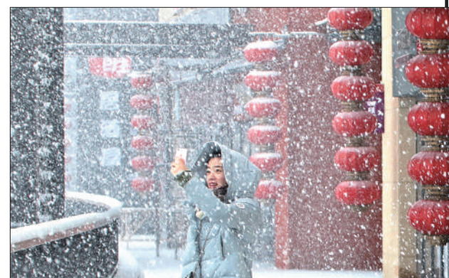
《冬雪飘飘》 摄于山东烟台市上市里广场。 ▲点评：纷纷扬扬的雪花、火红的灯笼、俏丽的行人，将冬日的雪景精彩呈现。