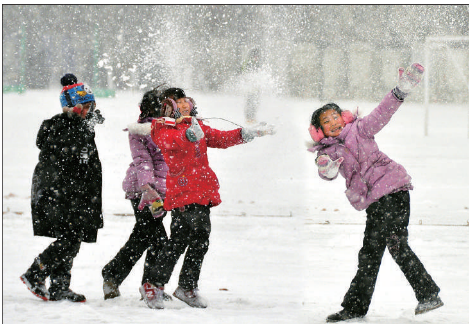
《雪中童趣》 摄于河南信阳市平桥区。 ▲点评：作者在大雪纷飞中，抓拍到位几位小朋友雪中嬉戏的场景，表达了人与自然的亲近感。作品瞬间精彩，画面打动人。