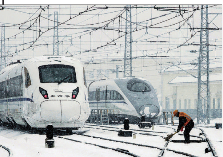
《风雪坚守》 摄于陕西西安动车段。 ▲点评：冰雪寒冬里，两列待发的动车与正在清扫轨道的工人形成鲜明对比。作品刻画出铁路工人为保证交通安全正在艰辛地付出。