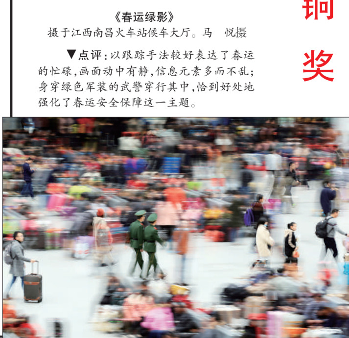
《春运绿影》 摄于江西南昌火车站候车大厅。 ▲点评：以跟踪手法较好表达了春运的忙碌，画面动中有静，信息元素多而不乱；身穿绿色军装的武警穿行其中，恰到好处地强化了春运安全保障这一主题。