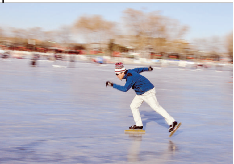
《驰骋冰场》 摄于北京什刹海。 ▲点评：作者采用追随拍摄方法巧妙地把被摄者蓝白相间的衣装与冰面、堤岸冷暖色调定格。作品动感十足，富有张力。