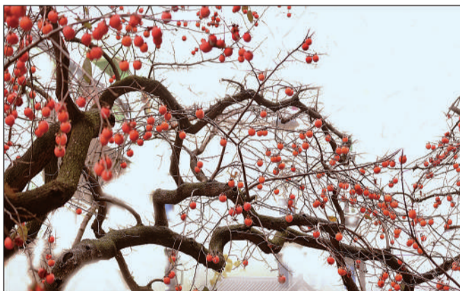
《冬季柿黄》 摄于江西南昌市西湖区羊子巷小学。 陈文萍摄 ▲点评：画面杂而不乱，黄黄的柿子、弯曲的树干，像一幅水墨画呈现在读者眼前，作品静中求美。