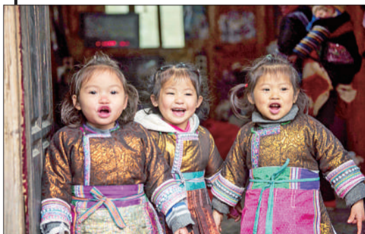
《娃娃放歌》 摄于贵州从江县。 ▲点评：这幅摄影作品妙在画面之外的遐想空间。身着冬装的娃娃的笑容足以打动读者。