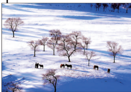
《雪乡幻影》 摄于黑龙江海林市。 ▲点评：雪原牧马的景色炫美，仿如童话世界，展现了北国冬季的魅力。