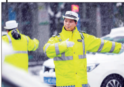
《冒雪执勤》 摄于江苏盱眙县淮河东路。 ▲点评：作者抓取了冒雪执勤的女交警工作瞬间，画面朴实动人。