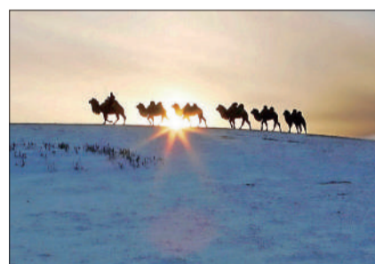
《夕阳归途》 摄于内蒙古赤峰乌兰布统。 ▲点评：雪原驼影的视觉效果靠的是作者耐心地等待和捕捉。