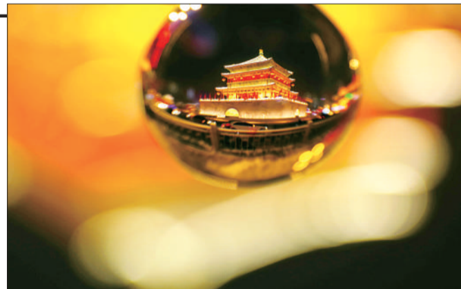
《梦幻钟楼》 摄于陕西西安市莲湖区。 ▲点评：作者利用微距摄影技术，将初雪后的古城呈现得别具意趣。