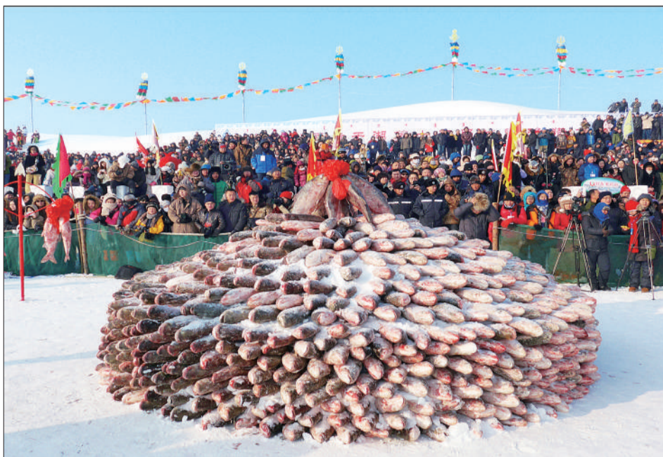
《冬捕丰收》 摄于吉林松原市前郭尔罗斯蒙古族自治县查干湖。 ▲点评：查干湖冬捕已成为东北冬季旅游的一张名片。图片中那堆成小山的肥美湖鱼，围观人群那一张张喜悦的笑脸，预示着新的一年美好生活的开始。