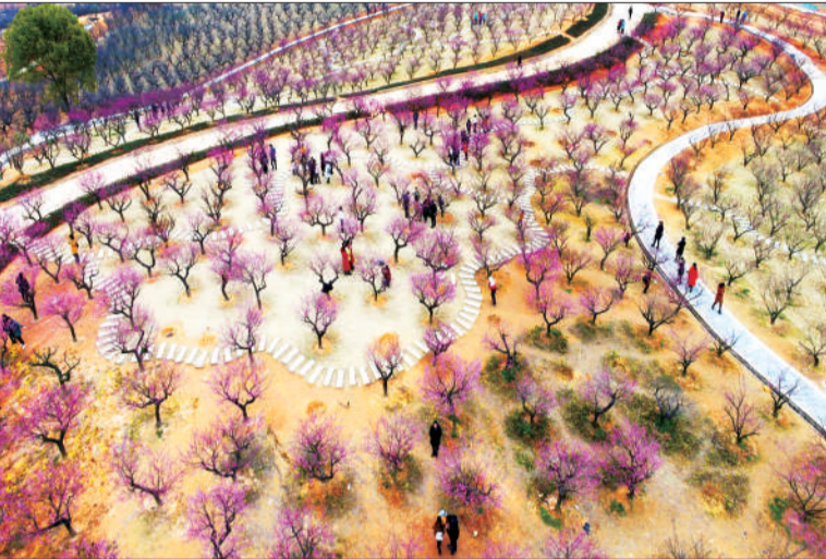
《红梅闹冬》 摄于江西赣州市大余县梅关风景区。 ▲点评：超大视角呈现，巧妙运用线条切割，让粉红色的花海与络绎不绝的游人相呼应。此图中见奇，体现了梅园之美。