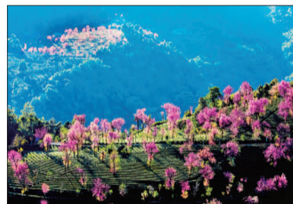
《冬樱盛开》 摄于云南大理州南涧县。 ▲点评：冬樱花在冬日的阳光下娇美动人，作品取景远近相宜，色彩分明。