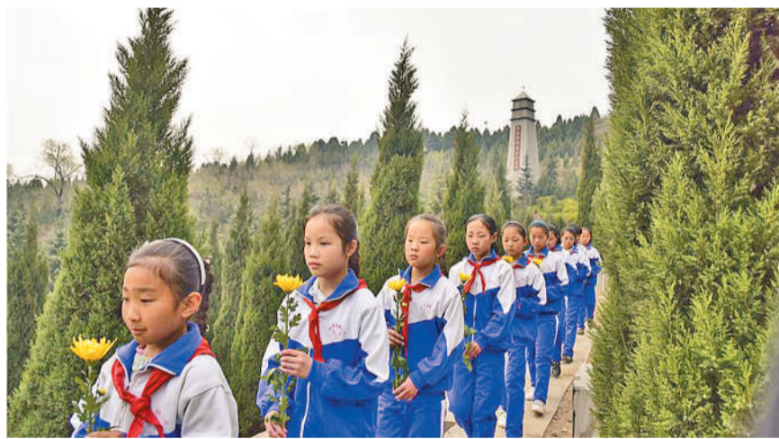
4月3日,少先队员在河北涉县将军岭革命烈士陵园献花。清明期间,当地开展了“祭拜先烈,缅怀英雄”主题活动。