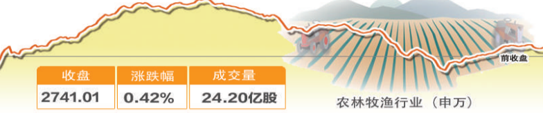
3月23日涨幅最大行业走势图