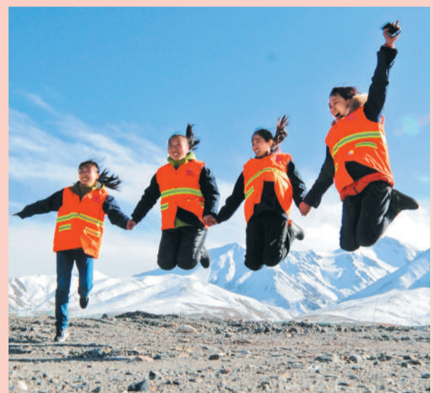
在青藏铁路格拉段玉珠峰站，中铁二十一局电务电化公司信号女子班“四姐妹”在海拔4100多米的昆仑雪山下一起跳跃。

进入新时代，我们还将面临更高的目标、更有质量的发展，也会有更多的艰难险阻等待我们去克服。我们坚定地相信，有了不畏艰难、锐意进取的奋斗，我们必将胜利实现中华民族伟大复兴的光荣梦想。