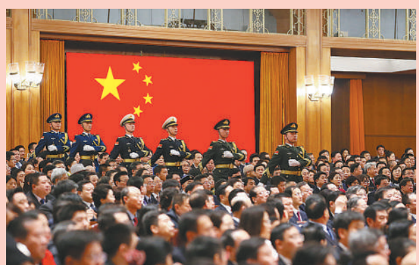
3月17日,中华人民共和国第十三届全国人民代表大会第一次会议宪法宣誓仪式在北京人民大会堂举行。这是陆海空三军仪仗兵正步行进。