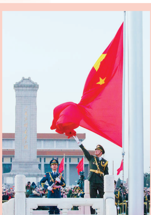
今年1月1日晨,北京天安门广场举行隆重的升国旗仪式,这是由人民解放军担负国旗护卫任务后,首次举行的升旗仪式。新华社记者 璐振华摄

办好中国的事情,关键在党。代表委员们认为,深化党和国家机构改革、国家监察体制改革,加快推进国家治理体系和治理能力现代化,努力形成更加成熟、更加定型的中国特色社会主义制度,我们党就一定能够更好领导人民进行伟大斗争、建设伟大工程、推进伟大事业、实现伟大梦想,创造无愧于时代、无愧于人民、无愧于历史的不朽业绩。