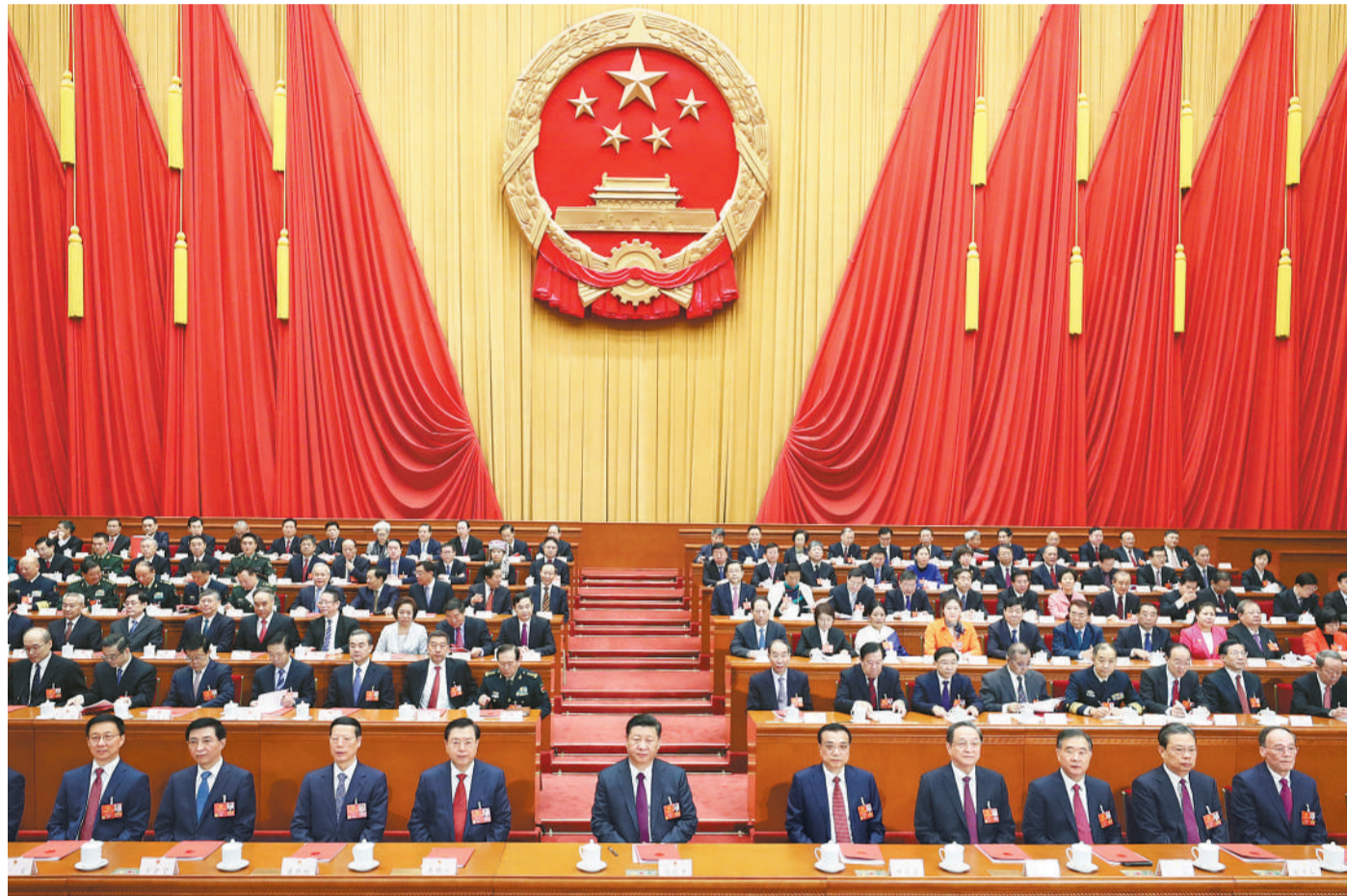
3月20日,第十三届全国人民代表大会第一次会议在北京人民大会堂闭幕。中共中央总书记、国家主席、中央军委主席习近平发表重要讲话。新华社记者 姚大伟摄