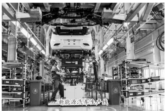
新能源汽车生产线

2017年，赣江新区经开组团分别在全国219个国家经开区中排名第47位和全国365个国家产业园中排名第34位，成为江西省唯一进入全国50强的国家经开区和国家产业园。