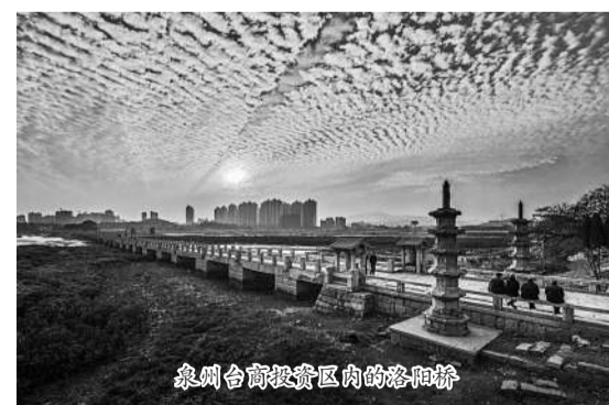
泉州台商投资区内的洛阳桥。

泉州台商投资区深入挖掘、传承、保护本土乡情、民俗文化、海洋文化,留住城市的“根”和“魂”。稳步推进洛阳古镇、洛阳古街、百崎回族文化特色小镇等古镇名村、传统村落、名人故居的规划、整治和保护,留住更多的“古早味”,守住历史风貌、乡土气息。