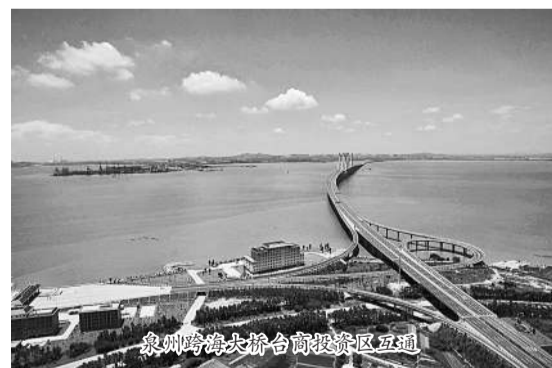
泉州跨海大桥台商投资区互通。

政策优势的叠加让这里成为创业热土,泉州台商投资区是国家台商投资区、国家经济技术开发区、国家高新技术产业开发区,实行国家“金改区”“民综合改革试点”“21世纪海上丝绸之路先行区”的优惠政策。近年来,随着中国中车、玖龙纸业、台资颐和医院、八仙过海旅游综合体等一大批重大项目的落地、投产,给泉州台商投资区插上腾飞的翅膀。