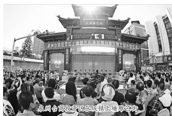
泉州台商投资区张坂镇土塘滩艺博园。

泉州台商投资区坐拥四通八达的交通系统,北有沈海高速公路、泉三高速公路南惠支线、福厦铁路、漳泉肖铁路和国道324线,南有石湖港区、秀涂港区和福建省道201线、泉州环城高速公路,距离泉州火车站8公里,距离福厦铁路惠安站14公里,距离福厦铁路泉州站不到20公里,距离泉州(晋江)机场约20公里。