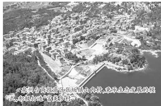
泉州台商投资区张坂镇山内村,秉承生态发展的模式,积极打造“富美乡村”。

泉州台商投资区地处福建省泉州市中心城区东部,与泉州市新行政中心隔海相望,是泉州市中心城区的重要组成部分。自2010年正式挂牌以来,因为区位优势优越、交通便捷、文化旅游资源丰富和各种政策加持,已经逐渐成为对台交流合作先行先试实验区和泉州经济新引擎。