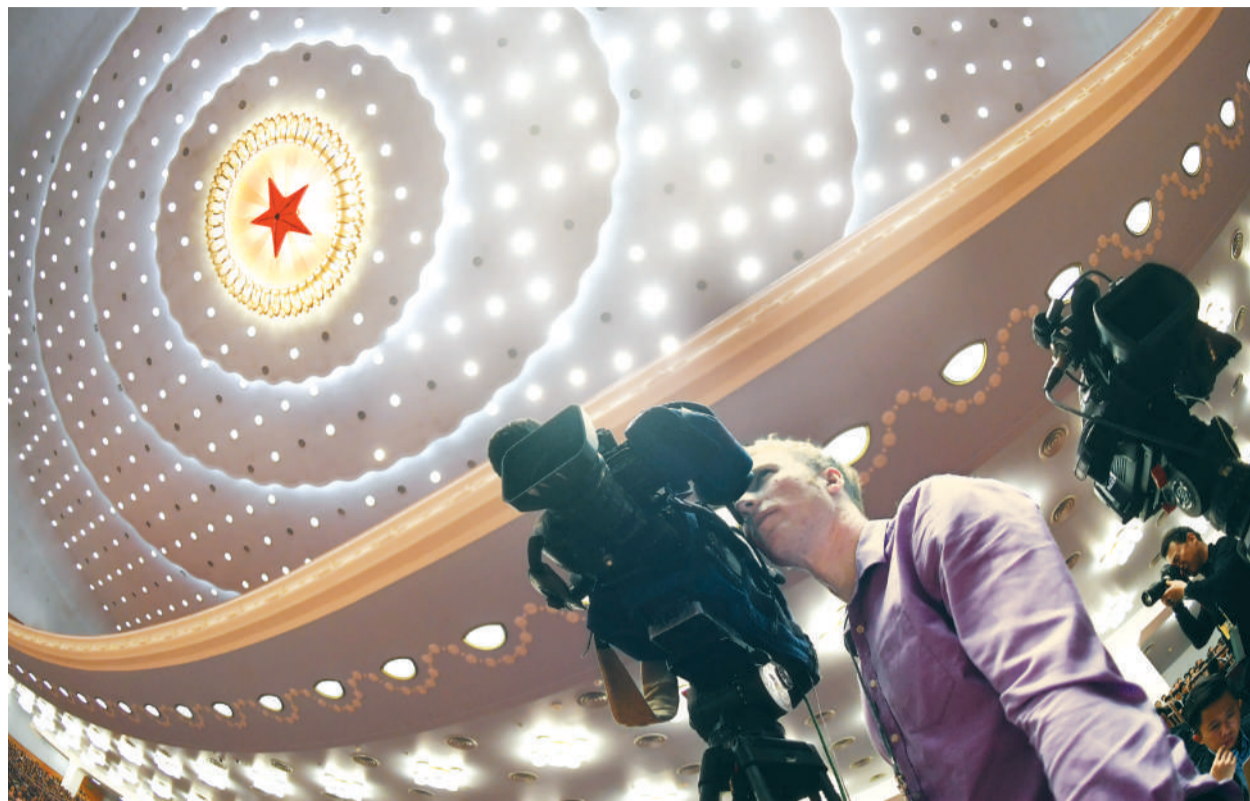
3月9日下午,北京人民大会堂,十三届全国人大一次会议第二次全体会议吸引了众多中外媒体聚焦。图为外国记者在采访报道。

连日来,海外媒体、专家学者高度关注中国两会,认为中国致力于追求高质量可持续发展的经济,不存在硬着陆的风险,将为全球经济稳定增长作出更大贡献。