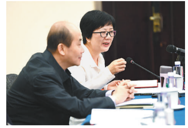
全国政协委员李明蓉(右)在发言中充分肯定司法改革的成就。