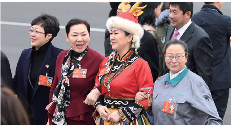
3月4日上午,北京人民大会堂。十三届全国人大一次会议举行预备会。人大黑龙江代表团的几位女代表,边走边议生态保护相关话题。