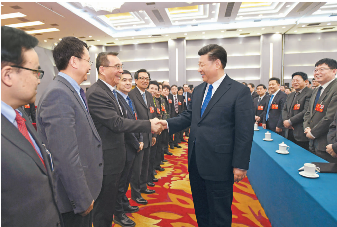
3月4日下午,中共中央总书记、国家主席、中央军委主席习近平看望参加全国政协十三届一次会议的民盟、致公党、无党派人士、侨联界委员,并参加联组会,听取意见和建议。中共中央政治局常委、全国政协十三届一次会议主席团会议主持人汪洋参加看望和讨论。

习近平强调,中共十八大以来的5年是极不平凡的5年,我们坚定不移高举中国特色社会主义伟大旗帜,统筹推进“五位一体”总体布局、协调推进“四个全面”战略布局,出台一系列重大方针政策,推出一系列重大举措,推进一系列重大工作,战胜一系列重大挑战,解决了许多长期想解决而没有解决的难题,办成了许多过去想办而没有办成的大事,国家经济实力、科技实力、国防实力、综合国力、国际影响力和人民获得感显著提升,中国特色社会主义建设取得了历史性成就,我们党、国家、人民、军队的面貌发生了历史性变化。这样的成就来之不易,是中共中央坚强领导的结果,是全国各族人民共同奋斗的结果,也凝结着各民主党派和无党派人士、各人民团体以及广大政协委员的心血和智慧。