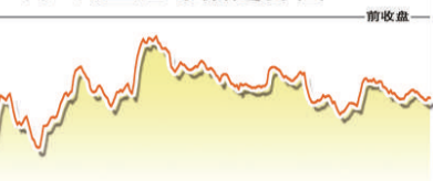
上证综指 深证成指