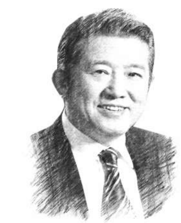
泰康保险集团创始人、董事长兼CEO 陈东升