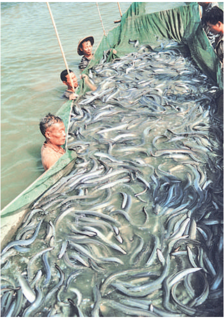
广东顺德,一度是传统鳙鱼养殖基地。

异军突起的乡镇企业,开拓出顺德全新的发展局面,作为全国最大的家电生产基地,以全国万分之一的土地面积创出了全国16%的名牌产品,知名家电品牌不断涌现。“万家乐,乐万家”“美的,原来生活可