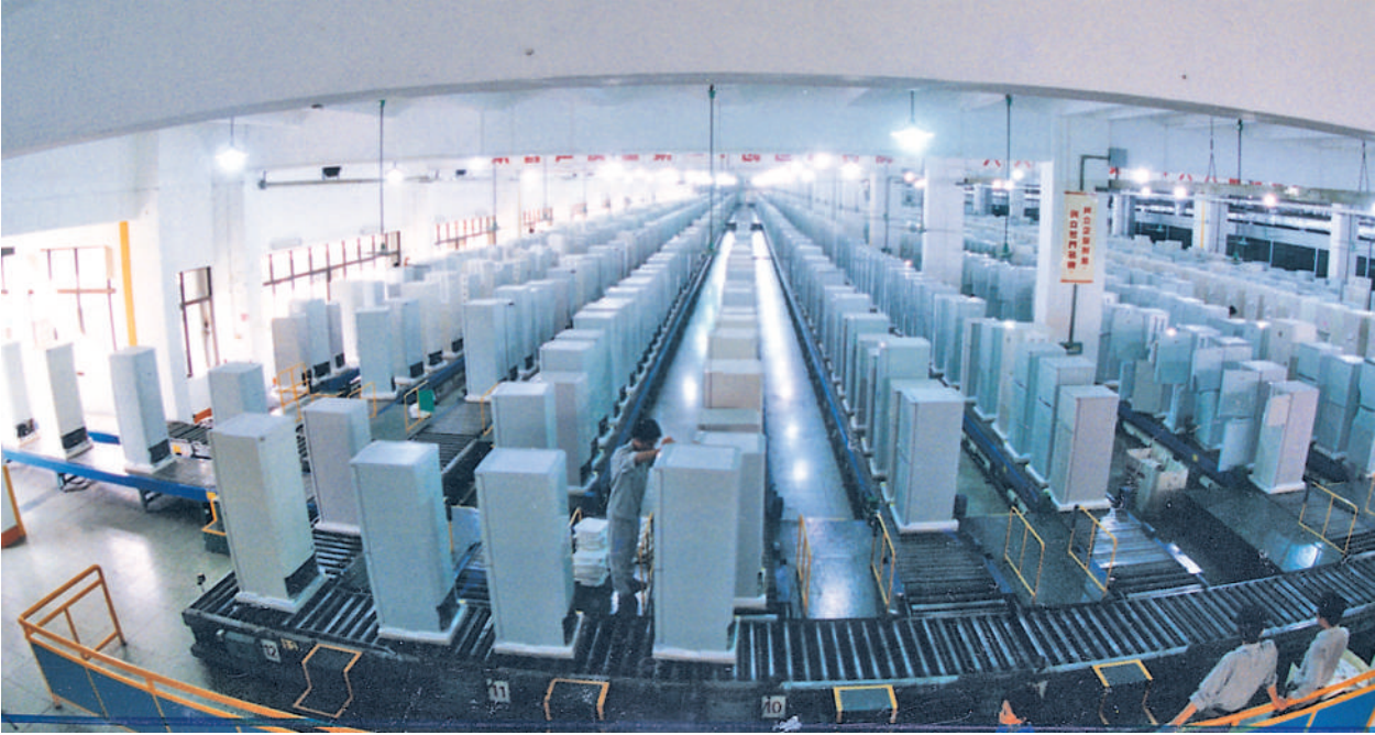
上世纪八九十年代,坐落在广东顺德的全国规模最大的电冰箱生产基地。

1978年8月8日,“可怕”的顺德人“胆大”地干了一件事:建成全国最早一家“三来