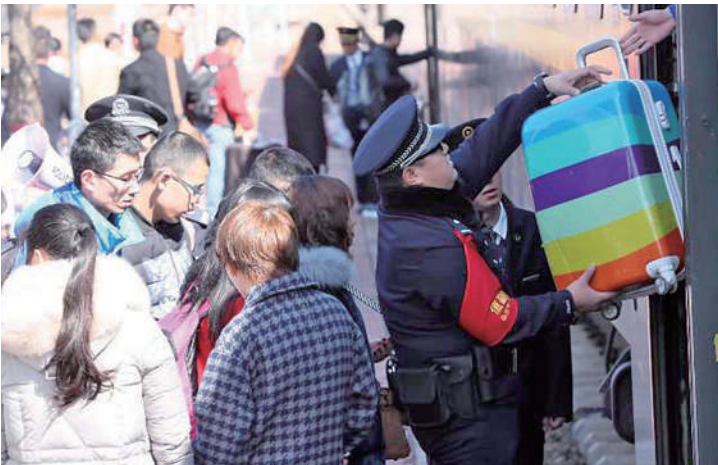
近日，临汾铁路公安处执勤民警在山西运城北站帮助旅客乘车。铁路迎来节后返程客流高峰，运城北站铁路民警全员上岗，帮忙携带行李多、带小孩行动不便的旅客乘车。

针对节后客流叠加，铁路部门积极挖潜提效。兰州局集团公司增开兰州、银川至北京西、上海、西安北等方向跨局列车6对；郑州局集团公司加开郑州至焦作间10趟往返城际列车；成都局集团公司成都东站与地铁建立安检互信关系，旅客从成都东站出站后不用安检可直接转乘地铁。