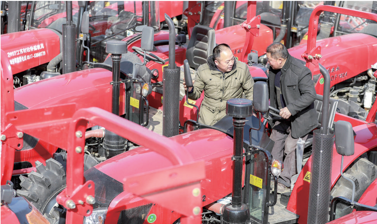
2月26日，几位农民在江苏省盱眙县农机市场挑选农机。随着天气转暖，各地农机市场迎来销售高峰，许多农民抓紧时间选购拖拉机、播种机等农业机械，备战春耕生产。

当前，鲜活农产品供给保障有力。前期低温雨雪天气对蔬菜生长产生一定影响，但随着优势产区面积增加、气温回升，市场供给得到有效保障。据监测，1月底580个蔬菜重点县信息监测点在田蔬菜面积同比增加1.4%。生猪产能有序调整，供应充足。