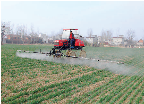
2月26日，河南唐河县振群家庭农场农民在给小麦喷施灭草剂。近日，当地农民积极抓住天暖有利时机忙春耕，保丰收。

2017年11月，工业和信息化部发布了关于启动5G技术研发试验第三阶段工作的通知，要求有关单位明确第三阶段建设目标、内容和指标要求，加快完成试验环境的建设与优化，加快设备研发，开展融合试验，加强统筹协调，力争于2018年底前实现第三阶段试验基本目标，支撑我国5G规模试验全面展开。据介绍，在本次测试中，华为就《面向R16及未来的新功能及新技术验证》规范中定义的低时延高可靠进行了更丰富场景下的测试。