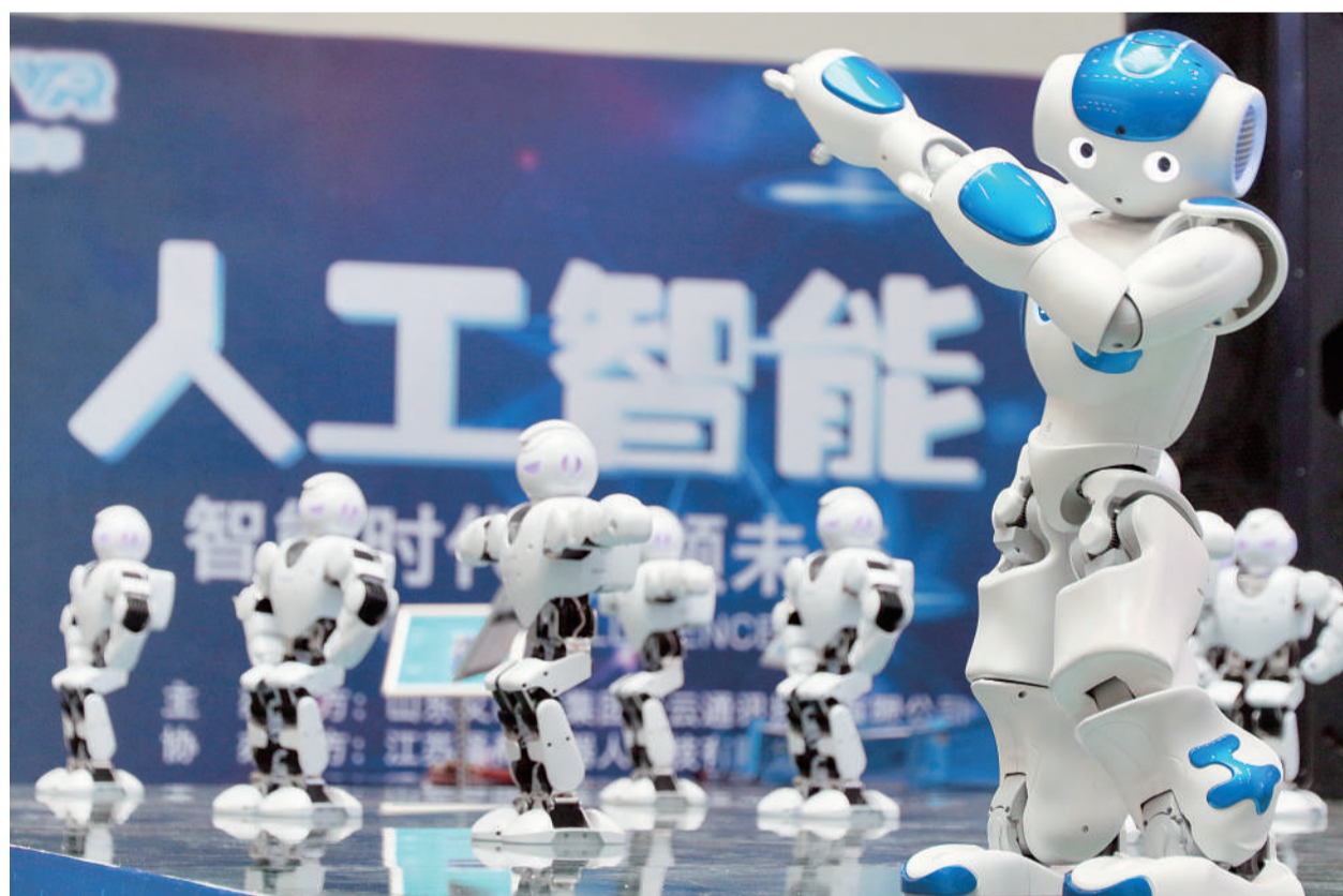
2月4日,在山东烟台旅游大世界,机器人在进行街舞表演。当前,我国机器人产业进入高速发展期,为经济持续稳定发展提供了新动能。

党的十八大以来,在以习近平同志为核心的党中央坚强领导下,我国坚持以推进供给侧结构性改革为主线,加快推动经济结构战略性调整和经济转型升级,经济发展的协调性和可持续性不断增强。