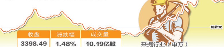
2月23日波动最大行业走势图