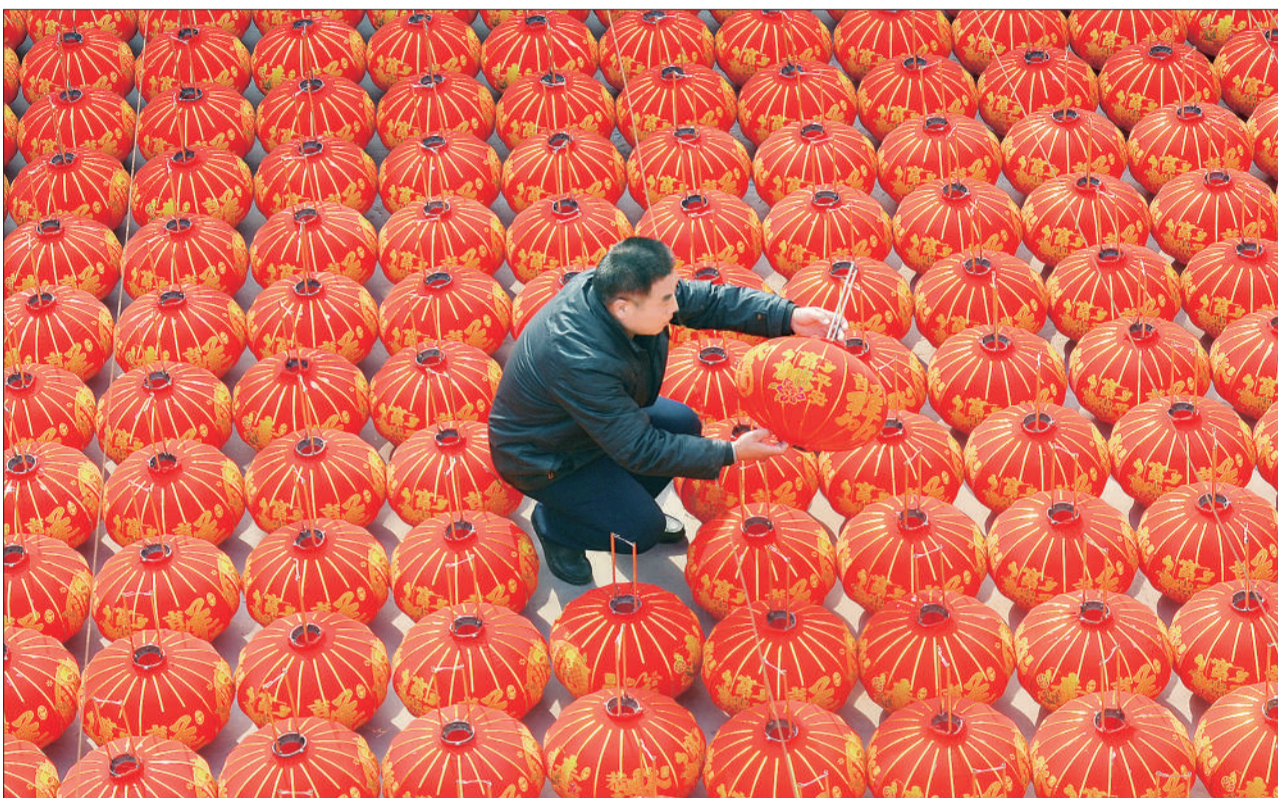
▲河北石家庄市藁城区中华宫灯厂员工在检查即将出售的产品。