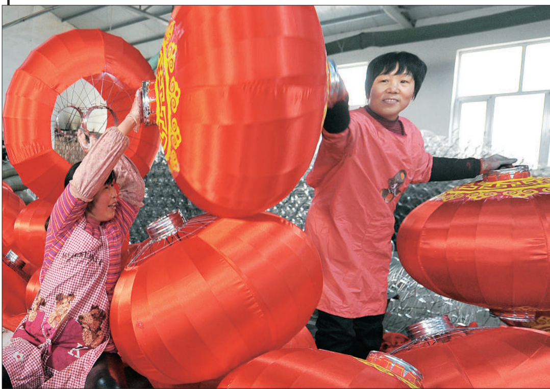
▲春节前夕，藁城区屯头村家家赶制灯笼，准备供应节日市场。