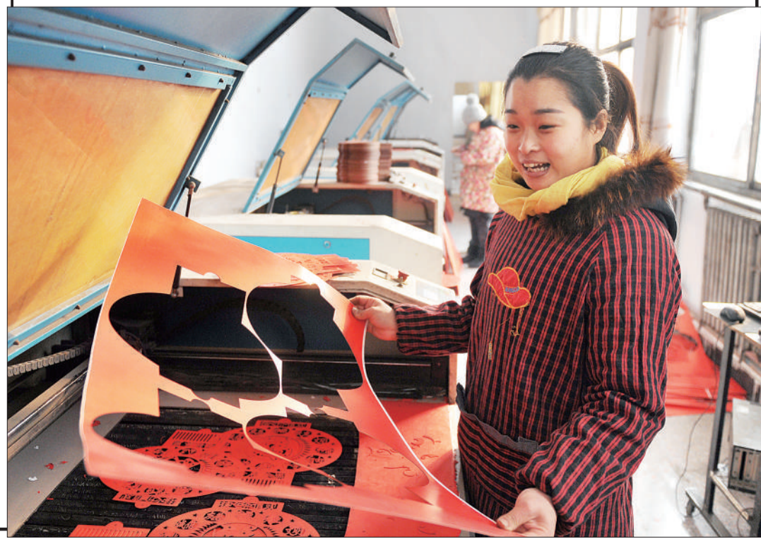
▲藁城区宫灯研制开发中心有限公司员工使用激光雕刻机制作灯笼。

本版主编 李景录 编辑 高兴贵 邮箱 jjrbsyb58392306@163.com