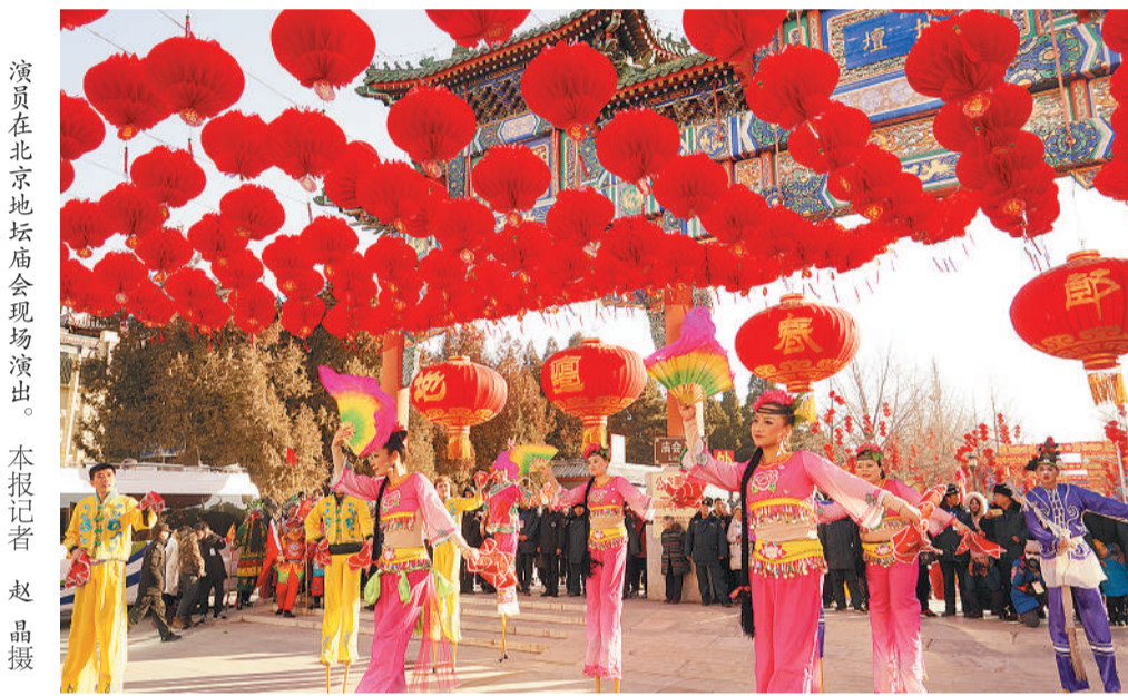
演员在北京地坛庙会现场演出。

正月初一,历时5天的北京地坛庙会开门迎客。9时整,在150余名“文武百官”“侍卫仪仗”的前呼后拥下,身着祭祀盛装的“皇帝”缓步登上方泽坛,按照史书记载程序举行祭地仪式,祈求新的一年风调雨顺。