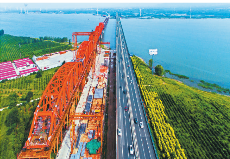
正在修建的京张高铁官厅水库特大桥为简支拱形钢桁梁,横跨官厅水库。与G6高速官厅水库桥并行。(资料片)

百年前,中国铁路的修筑权被西方列强把持,英俄两国为争夺北京到张家口铁路修筑权互不相让,詹天佑曾慨叹“我国地大物博,而于一路之工,必须借重外人,引以为耻”。1905年5月,袁世凯奏准开办京张铁路,于天津设京张铁路局,筹备筑路事宜。曾经的留美幼童、当时的邮传部二等顾问官詹天佑扛起重担,担任京张铁路工程总办兼工程师,他引领1万多人,自光绪三十一年(1905年)九月至宣统元年(1909年)八月,仅仅用了四年时间,就修建好这条全长201公里的铁路。詹天佑在《京张铁路工程纪略》中记述了京张铁路工程线路及地理状况:“由丰台之柳村 趋东而北 沿都城 越清河 抵南口 穿八达岭 出岔道城 跨怀来 宣化 以达张家口 延袤三百六十余里 其中层峦叠嶂 盘路峭石 实居全路十分之一 境险工艰 以及曲线坡度各作法……”京张铁路丰台至南口段、南口至关沟段、关沟至张家口段这三段中,以第二段的施工最为艰难:八达岭隧道从两端同步开凿,并在中部开出两个直井,再分别向双向推进,一公里长的隧道高效贯通,开创我国隧道修筑的首例;青龙桥独特的人字形铁路设计,解决了因地势急速提升,给火车带来爬坡的巨大难关,成为山区铁路修筑的典范。