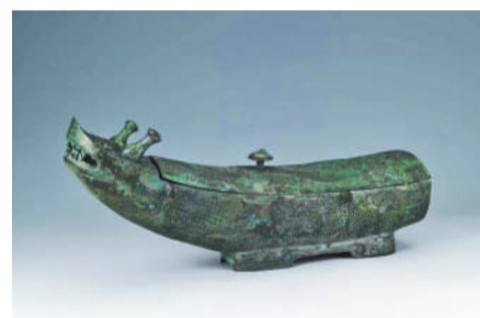
图为山西博物院的馆藏文物龙形觥。

普通读者跟名家名师读经典名作,名家与公众在阅读经典上形成合力,产生共振,实在是一个性价比高的多赢组合——名家分享快乐;读者收获了名师的独门秘技、私家收藏,以及文学王国的“入场券”“旅行券”;出版社收获了丰厚利润,我们还收获了社会人文素养的提升……期待这样的书更多些,读它们的读者更多些!