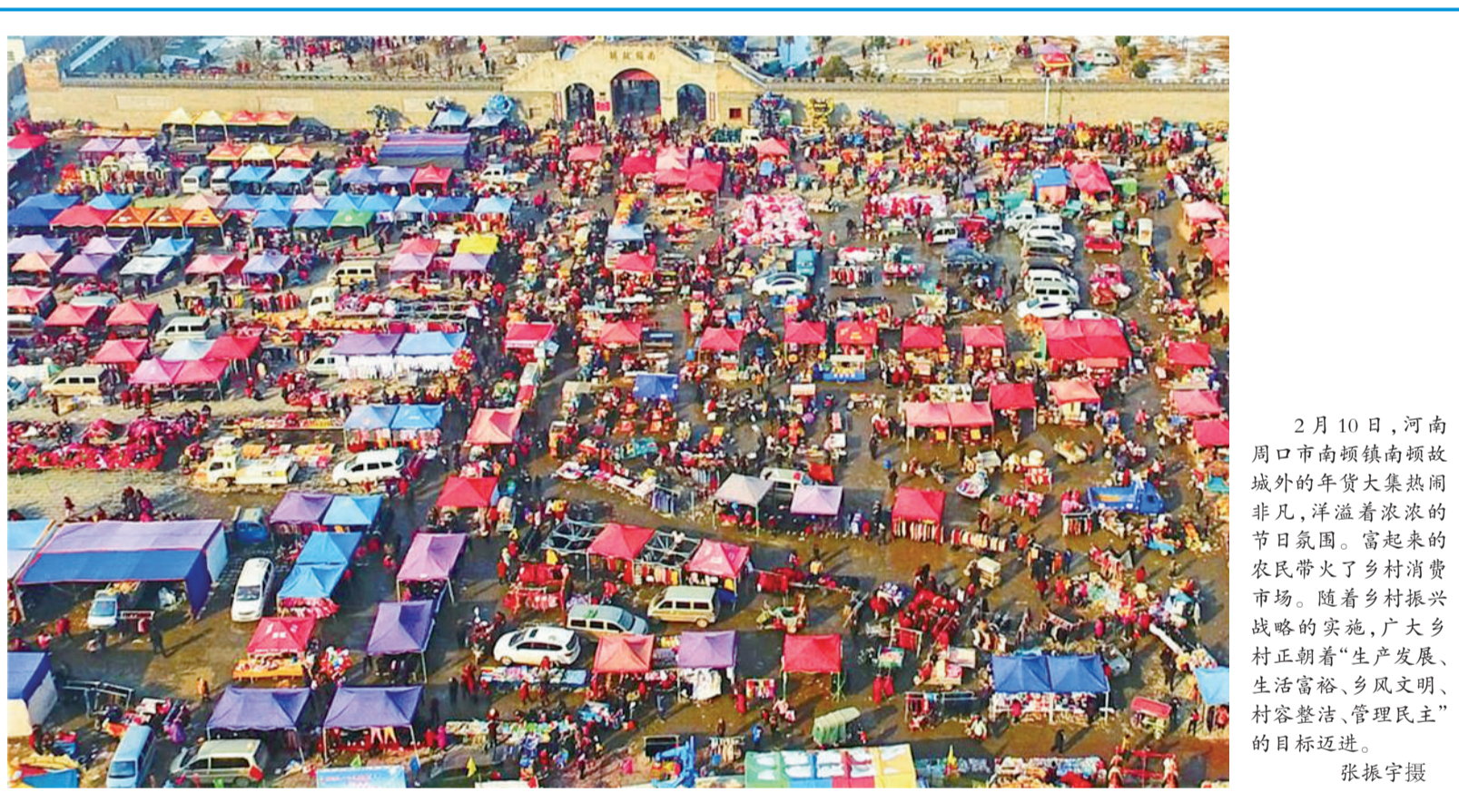
2月10日,河南周口市南顿镇南顿故城外的年货大集热闹非凡,洋溢着浓浓的节日氛围。富起来的农民带火了乡村消费市场。随着乡村振兴战略的实施,广大乡村正朝着“生产发展、生活富裕、乡风文明、村容整洁、管理民主”的目标迈进。

三管齐下,为宁波企业构建了强大的内生驱动力。越来越多的“宁波制造”从宁波舟山港扬帆出海,在港产联动中为宁波开放注入强劲动能。“一带一路”也正成为甬企拓展海外市场的新蓝海。位于北仑的天时国际,其主要市场在亚非拉国家,在约50个国家拥有品牌代理商。该公司通过经营贝宁中国经济贸易发展中心,还开始为甬商在西非开展国际贸易、境外投资提供各种便利。 与此同时,以中东欧博览会为窗口,“一带一路”沿线国家和地区的商品早已进入宁波消费者的日常生活。与“一带一路”沿线国家和地区间的贸易畅通,成为带动宁波外贸发展的新引擎。