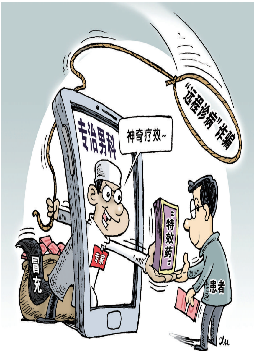
徐 骏作